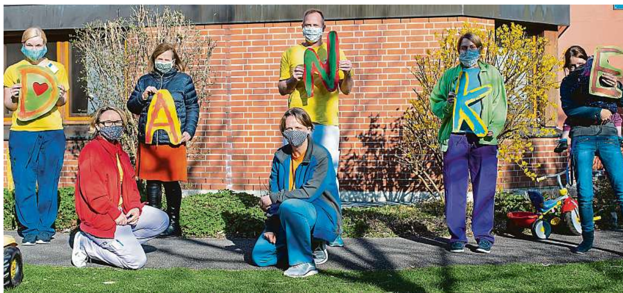
Koronavirus v Německu. Zaměstnanci Dětského domova AtemReich v Mnichově děkují lidem za darované obličejové masky.

Doba nemoci COVID-19. „Politika, jak jsme ji znali doteď, trochu ustupuje stranou. Na jak dlouho?“ ptá se politolog Jan Kubáček. Projev. Lidštější byl ten Babišův. Hamáček. Vydrží-li, může to CSSD pomoci STRANA 2