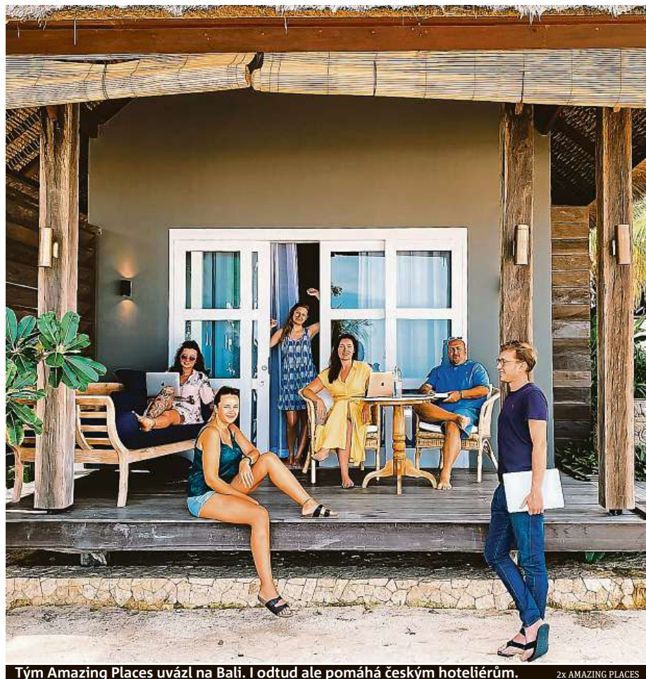
Tým Amazing Places uvázl na Bali. I odtud ale pomáhá českým hoteliérům.

V našem portfoliu jsou na tom samozřejmě nejlépe majitelé chalup, apartmánů, případně malých penzionů, kteří objekty vlastní a nemají žádné zaměstnance či minimum. Naopak hoteliéři, kteří platí enormně vysoké nájm,