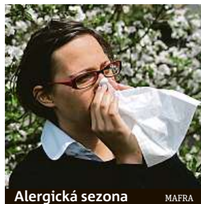
Alergická sezona MAFRA

Vznik alergického zánětu a s ním spojených příznaků onemocnění má na svědomí hormon histamin, který se v těle uvolňuje během alergické reakce. Projevů může být celá řada, například svědění a zarudnutí očí, kýchání, vodnatá rýma, ucpaný nos, svědění v krku, ústech či uších, dušnost, ale i únava, ekzémy a vyrážky. Pro pylovou alergii je charakteristický sezonní výskyt. U nás je to obvykle od konce února do podzimních měsíců. Obtíže vznikají pouze při kontaktu s pylovými zrny. Klimatické změny v posledních letech však způsobují, že některé byliny kvetou