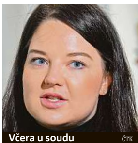
Včera u soudu

Vnučce slavného výtvarníka nepatří práva z jeho díla, rozhodl soud.