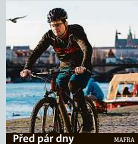
Před pár dny

Do včerejška měli dovozci polského hovězího dodat Čechům testy masa na salmonelu z certifikované laboratoře. Poláci měli podle dohody písemně informovat Evropskou komisi i Česko, že přijímají všechna slíbená opatření. Nestalo se tak. Veterináři zatím nebudou rušit mimořádná opatření. Češi kvůli skandálům ztrácejí o polské maso zájem. IDNES.cz