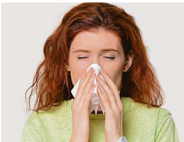
Svědění v nose je příznakem alergické rýmy.

K projevům onemocnění patří vodnatá rýma, svědění nosní sliznice, kýchání a pocit ucpaného nosu. O alergické rýmě hovoříme tehdy, pokud má pacient alespoň dva z nich. U pylové alergie se často vyskytují také oční příznaky, konkrétně svědění, slzení a zarudnutí spojivek. Alergickou rýmu lze od té infekční odlišit zejména podle průběhu. Kýchání, svědění nosu, současné poškození očí, pravi-