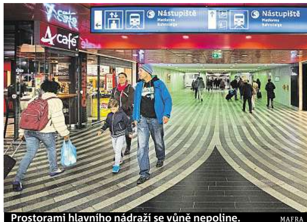
Prostorami hlavního nádraží se vůně nepolíne.

Už příští rok začnou práce na dvou klíčových pražských nádražních budovách. Ve středních Čechách se letos opraví nádraží v Kolíně, Hořovicích či Nelahozevsi. Zatímco letos probíhají z důvodu náročných projektové přípravy