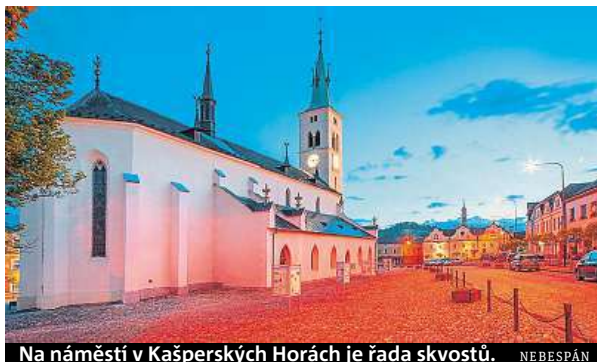
Na náměstí v Kašperských Horách je řada skvostů. NEBESPÁN

Druhou dominantou náměstí po radnici je více než 600 let starý arciděkanství