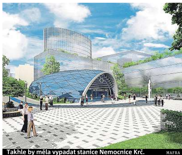
Takhle by měla vypadat stanice Nemocnice Krč.

Podle magistrátu příprava projektu pokračuje podle původního harmonogramu. Metrem D by se měli první cestující svést v roce 2025. Podle primátorky Adriany Krnáčové je zvolené řešení jediné, které umožní, aby se Praha v dohledné době dočkala nové trasy. „Pokud by navrhovaná varianta neprošla, mohla by Praha na dalších 15 let na nové metru zapomenout,“ dodává primátorka. FILIP JAROŠEVSKÝ