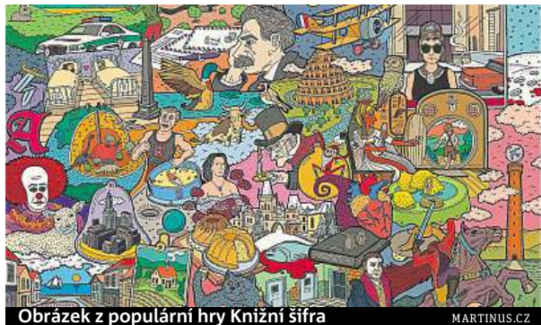
Obrázek z populární hry Knižní šifra MARTINUS.CZ

Kromě hmotných cen chceme z internetu také slevy nebo poukázky.