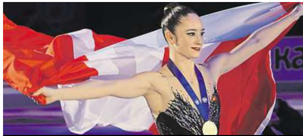
Kanadanka Osmondová, překvapivá šampionka

Ta byla velmi viditelná v soutěži mužů. Ve skupině, která bojovala o medaile, měl každý ze závodníků v plánu skákat minimálně tři čtverné skoky, ale nakonec se to povedlo jen vítězi Nathanu Chenovi. Ten zařadil hned šest čtverných skoků, získal celkem 321,40 bodu a rozdílem třídy porazil své soupeře. Další medaile si rozdělili ti, kteří ze všech nejméně chybovali a padali – stříbro si, stejně jako z her v Koreji, odváží Japonce Šoma Uno (273,77), bronz zamíří do Ruska s Michalem Koljadou (272,32).