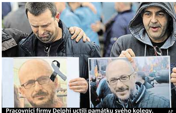
Pracovníci firmy Delphi uctili památku svého kolegy.

Místo tragédie navštívili německá kancléřka Angela Merkelová, francouzský prezident François Hollande a španělský premiér Mariano Rajoy. Kancléřka poděkovala záchranářům a jejich práci označila za známku obrovského přátelství a pomoci. „Jsem nesmírně