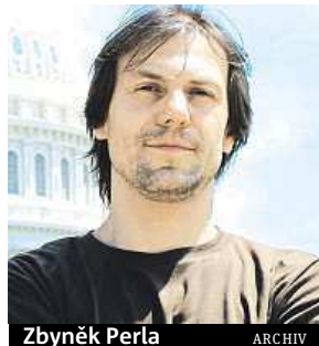
Zbyněk Perla ARCHIV

Po pěti týdnech poměrování míří do finále mezinárodní jazzová soutěž Czech Jazz Contest.