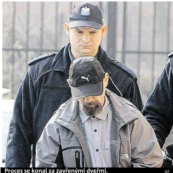
Proces se konal za zavřenými dveřmi.

Papež František již dříve vyhlásil nulovou toleranci vůči komukoliv v katolické církvi,