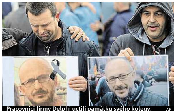
Pracovníci firmy Delphi uctili památku svého kolegy.

Místo tragédie navštívili německá kancléřka Angela Merkelová, francouzský prezident François Hollande a španělský premiér Mariano Rajoy. Kancléřka poděkovala záchranářům a jejich práci označila za známku obrovského přátelství a pomoci. „Jsme nesmírně