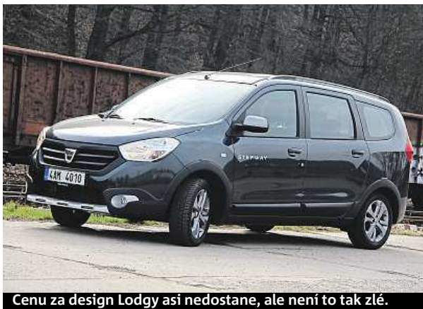
Cenu za design Lodgy asi nedostane, ale není to tak zlé.

„Pro sedadla jsem použil mix kůže a látky. Na střeše je ručně malovaná včela, která je další malou spojitostí s přírodou a historickým odkazem vozu. Nahradil jsem i typické hodiny. Můj design je známý tím, jakou pozornost věnuji detailům, a takový jsem chtěl i tento Defender,“ vysvětlil Smith. HO P