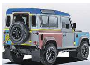
Speciální Defender LR