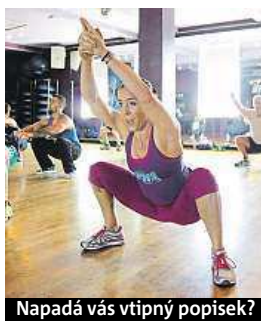
Napadá vás vtipný popisěk?

Napište bublinu a reagujte na sloupek na: www.facebook.com/denikmetro