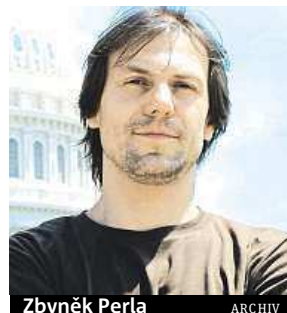
Zbyněk Perla ARCHIV

Po pěti týdnech poměrování míří do finále mezinárodní jazzová soutěž Czech Jazz Contest.