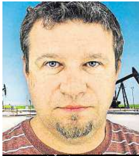
Unesený Čech INTERPOL

„Vítáme, že část unesených byla propuštěna a v úzké koordinaci se zahraničními partnery vyvíjíme maximální úsilí, aby byli propuštěni i zbývající uneseni,“ sdělila mluvčí českého ministerstva zahrani-