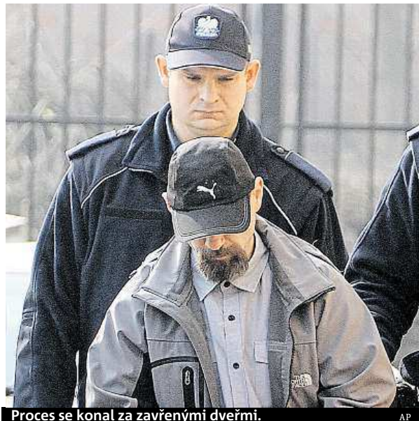
Proces se konal za zavřenými dveřmi.

Papež František již dříve vyhlásil nulovou toleranci vůči komukoliv v katolické církvi,