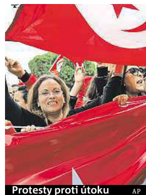
Protesty proti útoku

Skupinu, která zorganizovala teroristický útok na muzeum Bardo v tuniské metropoli, mělo tvořit celkem 16 extremistů. Dva z nich se vrátili do Tuniska z bojů v Sýrii. Sa-