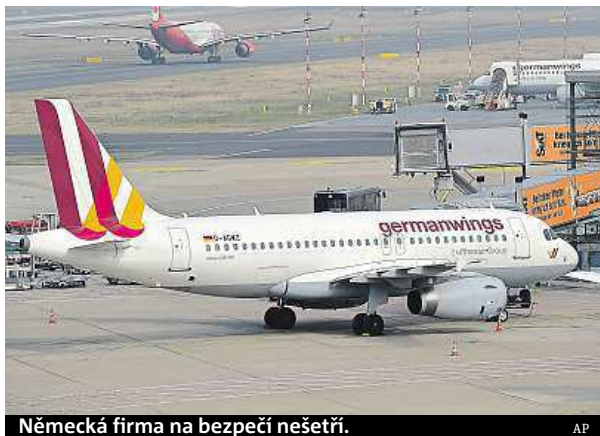
Německá firma na bezpečí nešetří.

„Probíhají prohlídky, kdy se třeba po celý měsíc letoun rozebírá do posledního šroubu