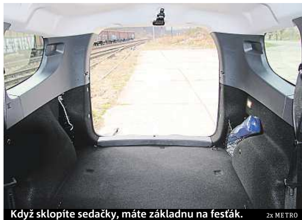
Když sklopíte sedačky, máte základnu na festák. 2x METRO