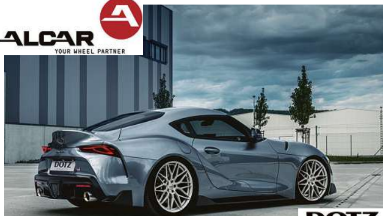
DOTZ Suzuka blaze