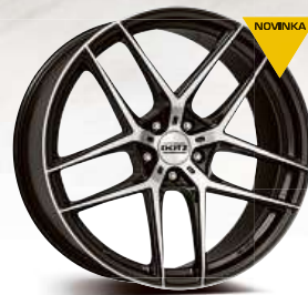
DOTZ LagunaSeca dark 19" - 21"