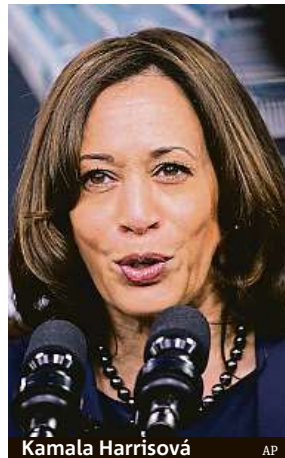
Kamala Harrisová

Data ohledně dosavadního postupu očkování proti ne-