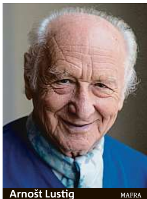
Arnošt Lustig

Publikace vyšla před několika dny a ukazuje i novinářskou práci Lustiga z druhé poloviny minulého století. Sice pracoval v Československém rozhlasu od roku 1948, ale nejstarší záznamy nejsou dochovány. „Byl novinář dobrodružný, pozorný, vnímavý. Říkal,