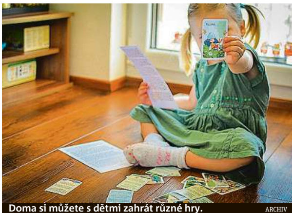
Doma si můžete s dětmi zahrát různé hry.

Nakreslete asi patnáct jednoduchých obrázků (domeček, sluníčko, kytky...), každý jinou barvou, než je obvyklé. Poschovávejte je po zahradě nebo v obývacím pokoji. Děti musí běhat s cílem si zapamatovat obrázky, následně je v opačném rohu místnosti nakreslit na papír. „Zdá se to jednoduché, ale fakt se