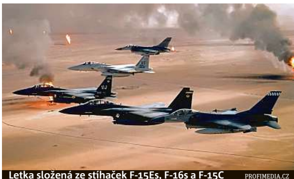
Letka složená ze stíhaček F-15Es, F-16s a F-15C

Jedna z největších vojenských konfrontací od druhé světové války, někdy nazývána první válka v „přímém televizním přenosu“, operace Pouštní bouře začala 17. ledna 1991 a skončila po pouhých 43 dnech, 28. února 1991 osvobozením Kuvajtu.