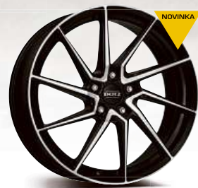
DOTZ Spa dark 17" - 19"