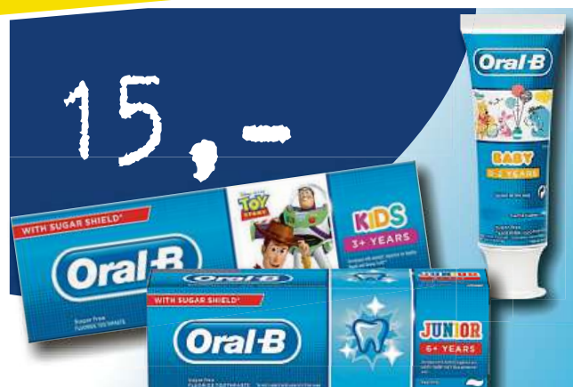
Zubní pasta pro děti ORAL B různé druhy 75ml jen za 15,- Kč