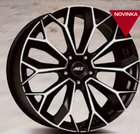
AEZ Leipzig dark 20" - 22"