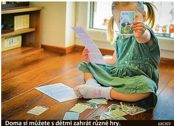
Doma si můžete s dětmi zahrát různé hry.

Nakreslete asi patnáct jednoduchých obrázků (domeček, sluníčko, kytky...), každý jinou barvou, než je obvyklé. Poschovávejte je po zahradě nebo v obývacím pokoji. Děti musí běhat s cílem si zapamatovat obrázky, následně je v opačném rohu místnosti nakreslit na papír. „Zdá se to jednoduché, ale fakt se