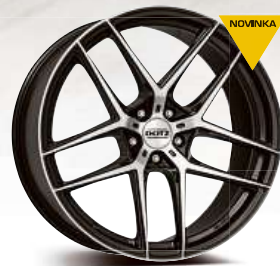
DOTZ LagunaSeca dark 19'' - 21''