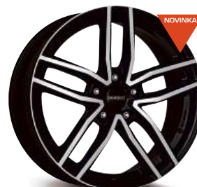
DEZENT TR dark 16'' - 18''