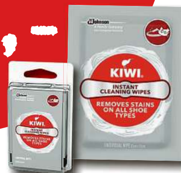
Čistící ubrousky na boty KIWI 4ks 2balení jen za 12,- Kč

K DOSTÁNÍ POUZE V OBCHODECH VÁŠ LEVNÝ NÁKUP