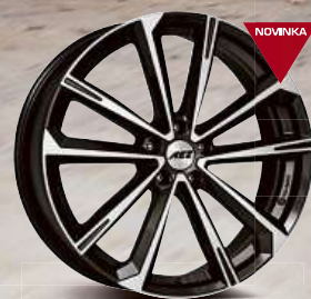
AEZ Aruba dark 18'' - 21''