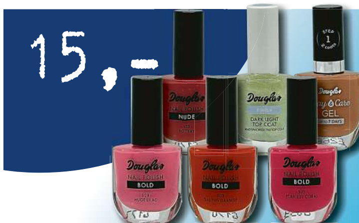
Lak na nehty Douglas mix odstínů 10ml jen za 15,- Kč