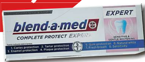
Zubní pasta blend a med EXPERT 50ml jen za 12,- Kč