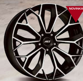
AEZ Leipzig dark 20'' - 22''