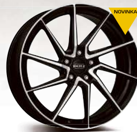
DOTZ Spa dark 17'' - 19''