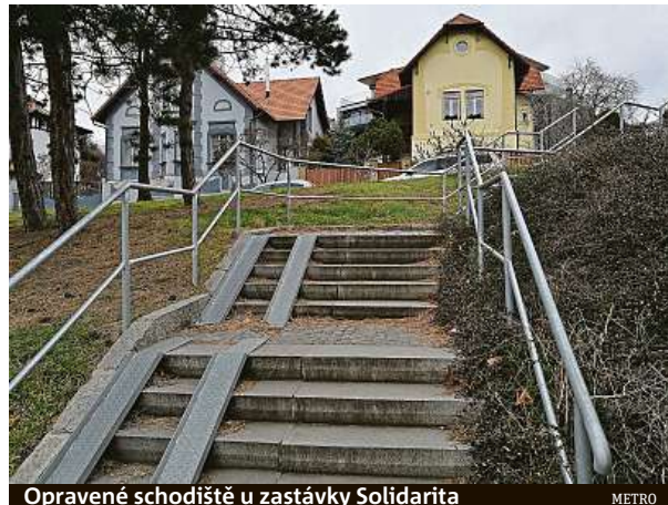
Opravené schodiště u zastávky Solidarita