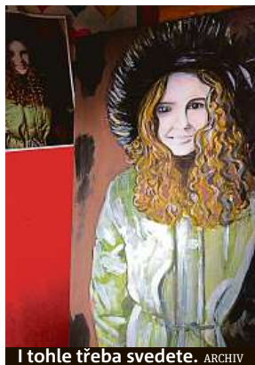
I tohle třeba svedete. ARCHIV

Národní galerie se snaží přiblížovat umění i nové generaci. Na pravidelných ateliérech kresby, malby, grafiky, sochařství, fotografie a multimediální techniky jsou ve Veletržním paláci výtvarné aktivity