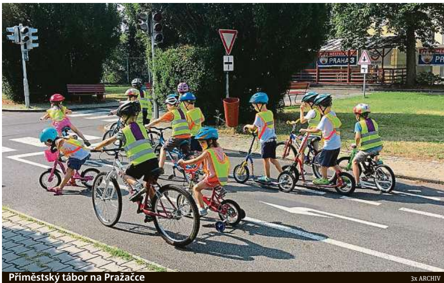
Příměstský tábor na Pražacké

Zdeněk Válek: Rodič povětšinou musí před prvním dnem dítěti zabalit něco s sebou (sportovní obuv, batůžek, lá-