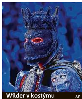
Wilder v kostýmu

Britského šampiona v boxu Tysona Furyho chce vyzvat jeho krajan Anthony Joshua.