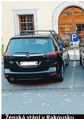
Ženská stání v Rakousku.

Ženská parkovací místa v Praze 9 jsou tuzemský unikát. V zahraničí jsou oblíbenější.