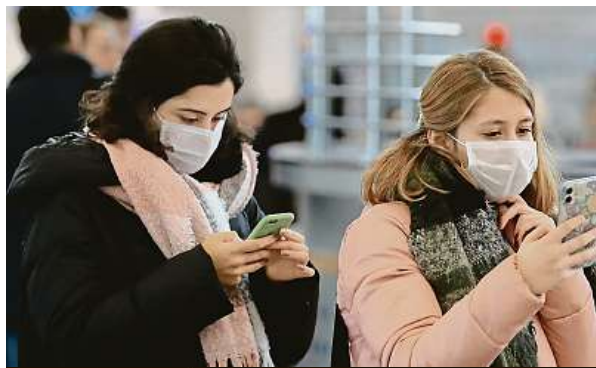
Cestující bez úsměvu na pražském letišti