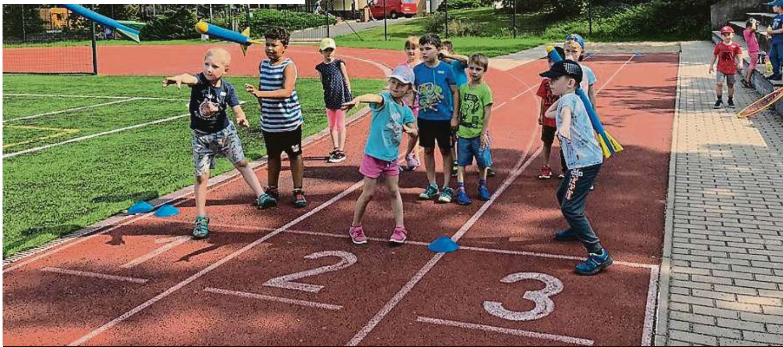
Zábava pro děti, úleva pro rodiče