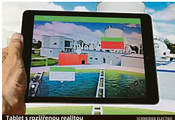
Tablet s rozšířenou realitou