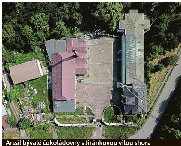
Areál bývalé čokoládozny s Jiráňkovou vilou shora

jekt podle developera předpokládá vznik tří až čtyř podlažních budov, celkem o 97 bytech pro rodinné bydlení a službami pro své i okolní obyvatele. „Projekt nezasahuje, jak je mylně uváděno, do parku Smetanka, využívá pouze zastavěných ploch bývalé čokoládozny. Je také zcela v souladu s platným územním plánem a obsahuje rozsáhlou dokladovou část s téměř osmdesáti kladnými stanovisky a vy-