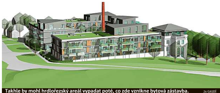
Takhle by mohl hrdlořezský areál vypadat poté, co zde vznikne bytová zástavba. 2x GAUDÍ

Kampaň proti přestavbě areálu bývalé čokoládozny v Hrdlořezích graduje. Podle developera šíří pomluvy.