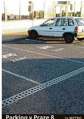
Parking v Praze 8. 2x METRO

Parkovací stání, na kterých je kromě symbolu osobního auta také namalovaný nápis – ženy, najdete v tuzemsku pouze na jednom místě. Nachází se u restaurace fastfoodové sítě McDonald's v Praze 9 u Mladoboleslavské dálnice. Ryze ženská stání jsou zde namalovaná již od jejího otevření před jedenácti lety. Ačkoliv zde tehdy stavaři na něžné pohlaví mysleli při budování speciálních stání pro auta, podle některých řidiček tak činili méně při budování vjezdu na parkoviště.