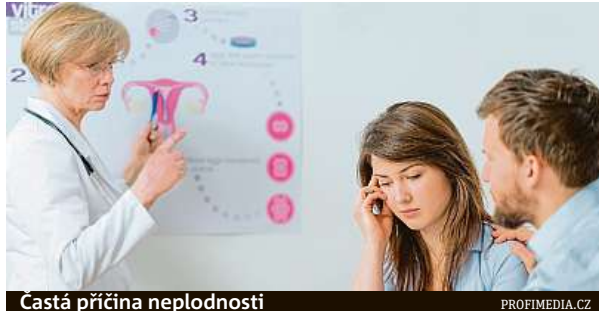
Častá příčina neplodnosti

Mezi typické příznaky endometriózy patří bolest v podbřišku, bolest při pohlavním styku, poruchy menstruačního cyklu a také neplodnost.