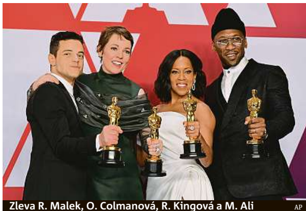
Zleva R. Malek, O. Colmanová, R. Kingová a M. Ali

Snímek řeckého režiséra Jorgose Lanthimose Favoritka, který se odehrává na brit-