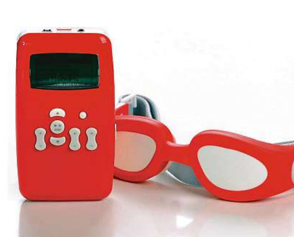
Dětem pomůže s učením či odstraněním ADHD. POSITIVE ENERGY

Během 15 minut relaxačního programu vstáváte osvěženi jako po hodinách dobrého spánku. AVS přístroj navozu-