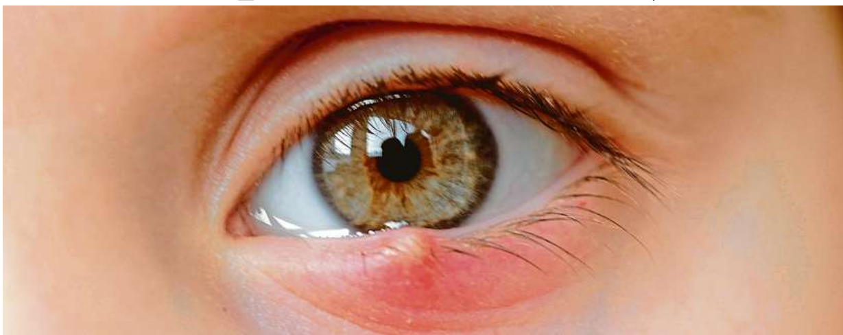
Obvykle je problém v ucpané mazové žlázce.

Ječné zrno se také může objevit na vnitřní straně očního víčka a nemusí být na první pohled vůbec patrné. Nemoc provází pocity ne-