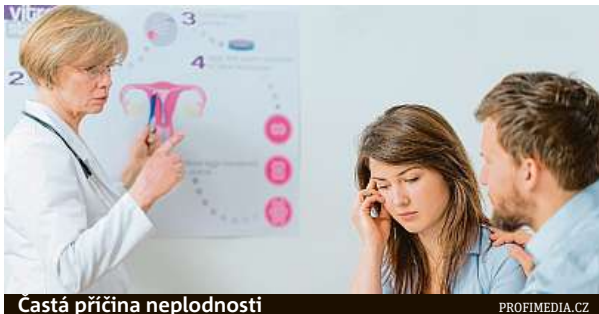
Častá příčina neplodnosti

Mezi typické příznaky endometriózy patří bolest v podbřišku, bolest při pohlavním styku, poruchy menstruačního cyklu a také neplodnost.