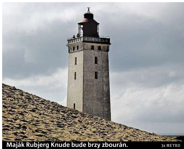
Maják Rubjerg Knude bude brzy zbourán.