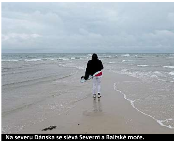
Na severu Dánska se slévá Severní a Baltské moře.