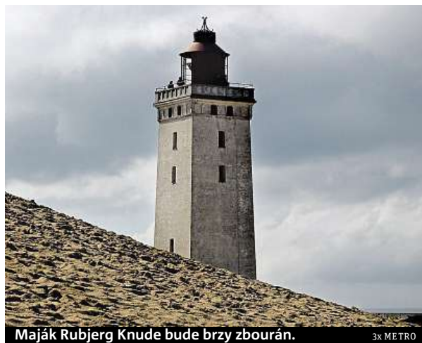
Maják Rubjerg Knude bude brzy zbourán.