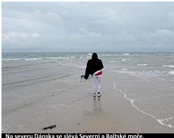
Na severu Dánska se slévá Severní a Baltské moře.