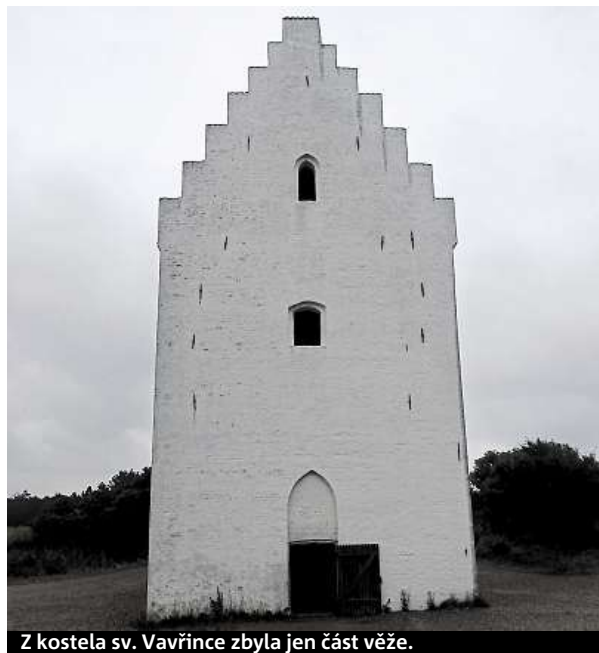
Z kostela sv. Vavřince zbyla jen část věže.