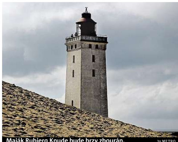
Maják Rubjerg Knude bude brzy zbourán.