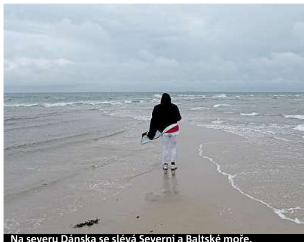
Na severu Dánska se slévá Severní a Baltské moře.