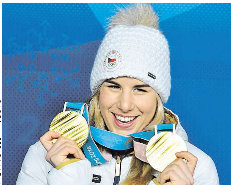
Dvojnásobná olympijská vítězka z Pchjongčchangu Ester Ledecká