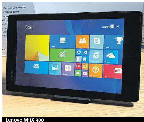
Lenovo MiiX 300

dů disponují vyšším výpočetním výkonem, větším úložným prostorem pro data a především plnohodnotnou hardwareovou klávesnicí, kterou ocení všichni prací povinní uživatelé. Tyto problémy však odpadají ve chvíli, kdy se rozhodnete pro vychytané zařízení 2v1 Lenovo MiiX 300. To v sobě snoubí výhody obou zařízení, a můžete se tak sami rozhodnout, která ze dvou variant použít pro vás bude právě v dané situaci výhodnější. Chcete se spíše bavit a konzumovat obsah? Sáhnete po tabletu s dotykovým 10.1" IPS displejem. Ten je navíc vybaven i dvojicí fotoaparátů o rozlišení 5 a 2 megapixely. Potřebujete více tvořit, napsat delší text, zkrátka neomezeně pracovat? Připojte tablet do dokovací stanice s klávesnicí a získáte výkonný notebook poháněný čtyřjadrovým procesorem Intel Atom. V obou režimech si můžete užít výhod systému Windows 10 a nejpoužívanější kancelářské sady MS Office.