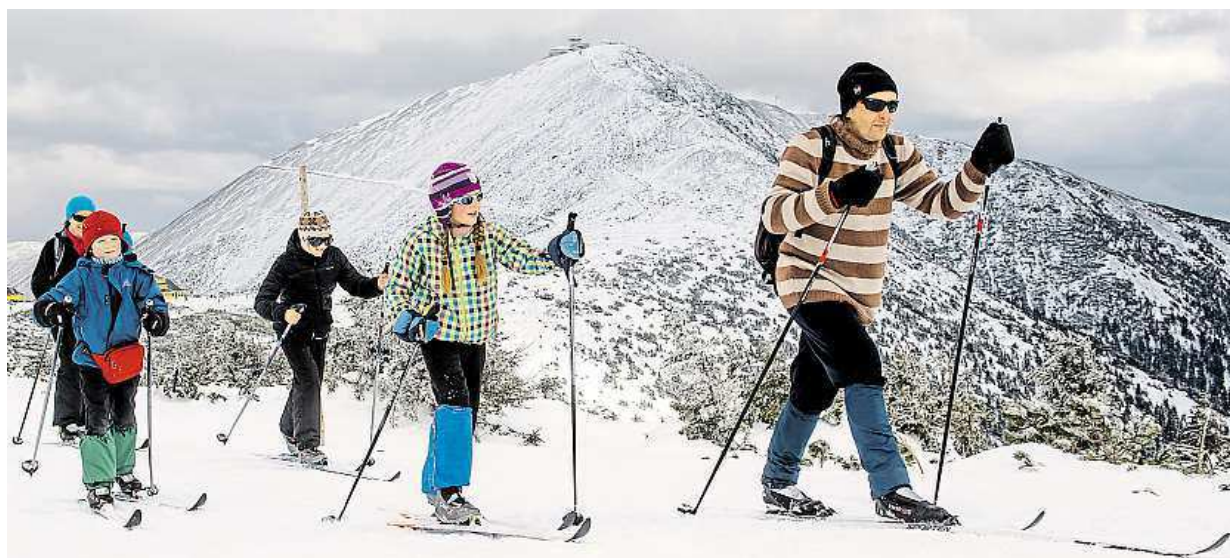
Ochlazení se sněžením zlepšilo podmínky pro lyžování také na hřebenech Krkonoš. Na horách by mělo sněžit i o víkend.

Dva nemocní. Osmapadesátiletý muž se nakazil na Martiniku, o devět let mladší žena pak v Dominikánské republice. Projevy. Příznaky chřipky a vyrážka. Varování. Ministr zdravotnictví vyzývá k obezřetnosti STRANA 2