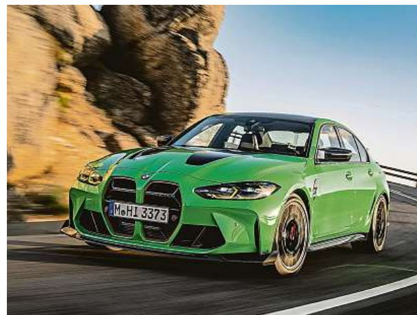
Nové BMW M3 CS stojí čtyři miliony korun.

Kombinuje přeplňovaný zážehový šestiválec M TwinPower Turbo s výkonem 550 koní s osmistupňovou převodovkou M Steptronic. HOP