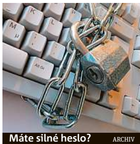
Máte silné heslo? ARCHIV

Znáte trik podvodníků, kteří se vydávají za pracovníky banky? Telefonicky se vás budou snažit přesvědčit, že váš bankovní účet byl napaden a jediná cesta k ochraně je převedení financí na jiný účet. „Podobných útoků celosvětově přibývá a zaznamenáváme i nárůst takových kampaní v českém jazyce. Často se také jedná o útoky cílené,