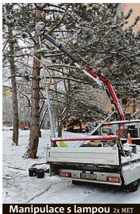
Manipulace s lampou 2x MET

Větve kolem lampy pracovníci THMP podle ní ořezat nemohou. Je to podobné jako se zarostlými značkami. THMP musí vyzvat k ořezání větví vlastníka pozemku. „Postup je však vždy stejný. Je nutné kontaktovat majitele, svévolně nemůžeme provádět žádné úpravy. Obecně platí, že pokud zeleň zasahuje do osvětlení, vždy je potřeba