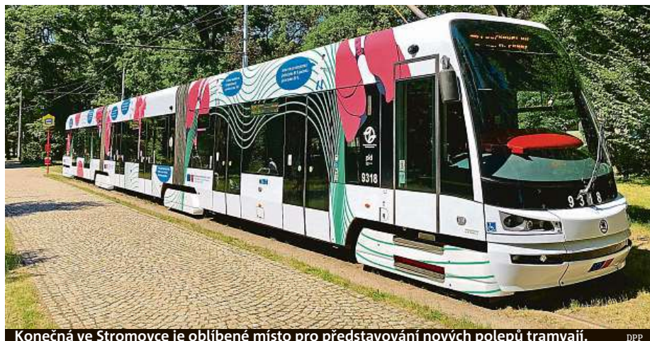
Konečná ve Stromovce je oblíbené místo pro představování nových polepů tramvají.

NÁVŠTĚVY PO TELEFONICKÉ DOHODĚ 602 229 348 sberatelskykabinet@post.cz