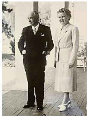
Hana s Edvardem