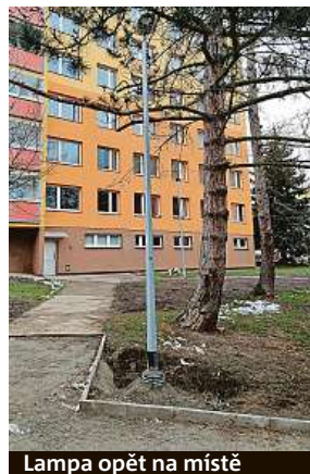
Lampa opět na místě

zajistit nápravu. Ve všech případech musí THMP kontaktovat vlastníka, tedy pokud roste zeleň ze soukromého pozemku, THMP vlastníka oběšle žádostí, aby zajistil nápravu, případně aby poskytl souhlas s úpravou zeleně. Některé pozemky spadají pod TSK, jiné pod magistrát a měst-