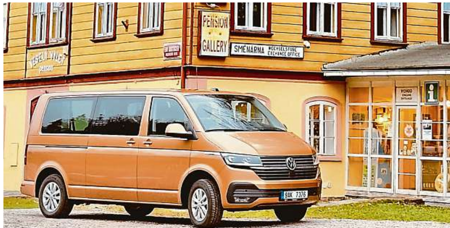
K domu Veselý výlet v krkonošském Temném Dole se auto vyloženě hodí!