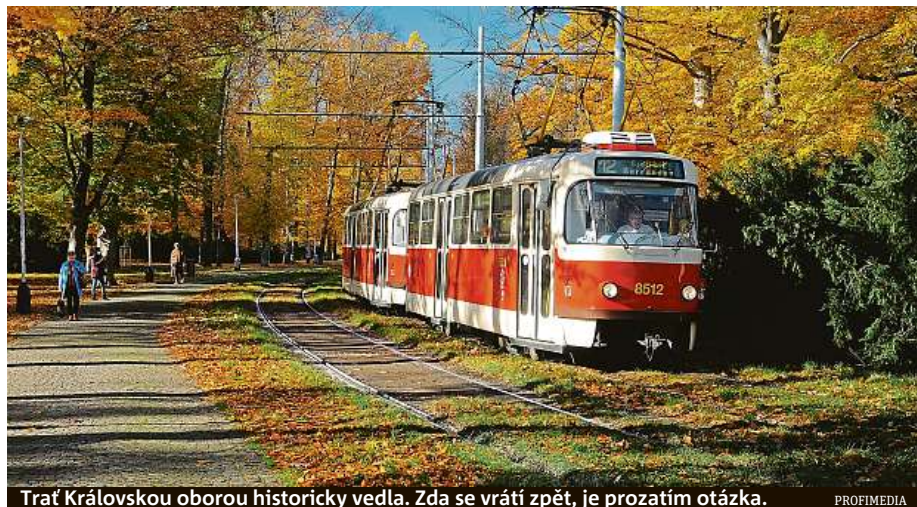
Trať Královskou oborou historicky vedla. Zda se vrátí zpět, je prozatím otázka.