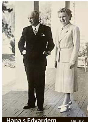
Hana s Edvardem