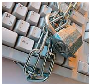
Máte silné heslo?

Znáte trik podvodníků, kteří se vydávají za pracovníky banky? Telefonicky se vás budou snažit přesvědčit, že váš bankovní účet byl napaden a jediná cesta k ochraně je převedení financí na jiný účet. „Podobných útoků celosvětově přibývá a zaznamenáváme i nárůst takových kampaní v českém jazyce. Často se také jedná o útoky cílené,