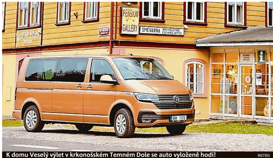
K domu Veselý výlet v krkonošském Temném Dole se auto vyložené hodí!