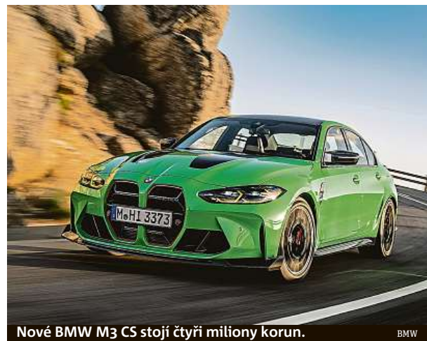
Nové BMW M3 CS stojí čtyři miliony korun.

Kombinuje přeplňovaný zážehový šestiválec M TwinPower Turbo s výkonem 550 koní s osmistupňovou převodovkou M Steptronic. HOP