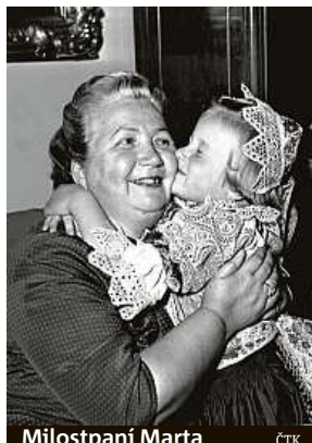
Milostpaní Marta