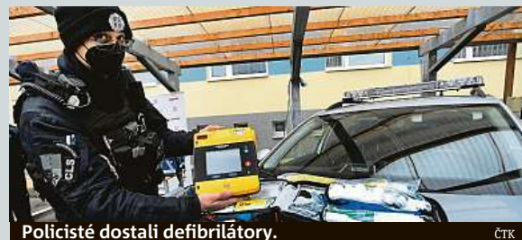
Policisté dostali defibrilátory.