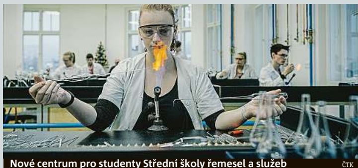
Nové centrum pro studenty Střední školy řemesel a služeb