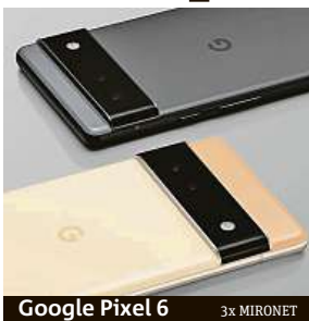
Google Pixel 6 3x MIRONET

Google navíc připravil odvažné designové inovace v podobě netradičního foto modulu nebo využil úplně nový čip