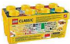
Lego je fenomén.

Okna, oči a množství různých kol nabízí nekonečnou řadu možností a stavění nejrozličnějších modelů a vozidel. Tě bude skutečně bavit. Jedná se o skvělý doplněk jakékoli