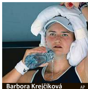
Barbora Krejčíková

Tenistka Barbora Krejčíková skončila ve dvouhře na Australian Open ve čtvrtfinále. Čtvrtá nasazená hráčka úvodního grandslamu sezony v Melbourne měla v horce od konce první sady utkání s Madison Keysovou zdravotní problémy a s Američankou prohrála 3:6 a 2:6. Vítězka Roland Garros Krejčíková hrála Australian Open potřetí v kariéře a postupem do čtvrtfinále