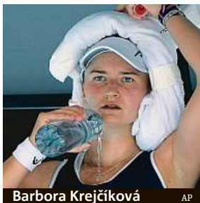
Barbora Krejčíková

Tenistka Barbora Krejčíková skončila ve dvouhře na Australian Open ve čtvrtfinále. Čtvrtá nasazená hráčka úvodního grandslamu sezony v Melbourne měla v horku od konce první sady utkání s Madison Keysovou zdravotní problémy a s Američankou prohrála 3:6 a 2:6. Vítězka Roland Garros Krejčíková hrála Australian Open potřetí v kariéře a postupem do čtvrtfinále