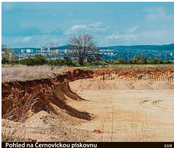
Pohled na Černovickou pískovnu

Kromě zadavatele soutěže, tedy města Brna, leží zachování divoké přírody na srdci i respondentům on-line ankety, kterou KAM vypsal loni v květnu. Zapojilo se do ní téměř