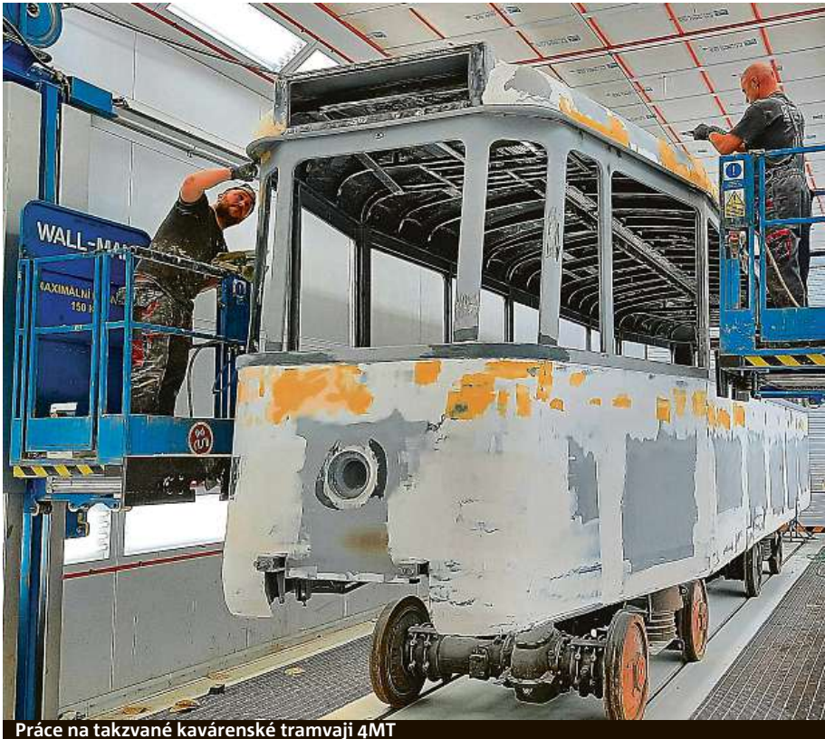
Práce na takzvané kavářské tramvaji 4MT

Historické autobusy nebo tramvaje Brňané tradičně vidají na městských akcích.