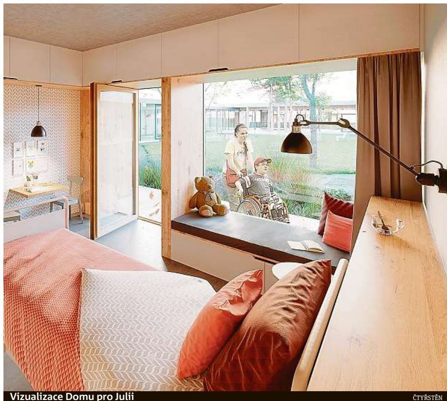
Vizualizace Domu pro Julii