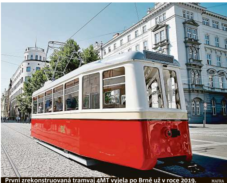
První zrekonstruovaná tramvaj 4MT vyjela po Brně už v roce 2019.