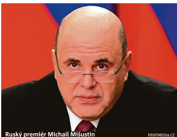
Ruský premiér Michail Mišustin

Čtyřiapadesátiletý Mišustin během dvanácti měsíců ve funkci zazářil – v žebříčku popularity je premiér po Putinovi druhý, důvěřuje mu od-