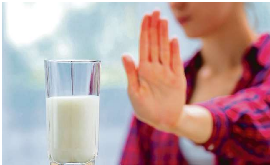
Kdo nesnese mléko, může trpět alergií na mléko nebo intolerancí laktózy.

Na trhu také najdeme rozsáhlou nabídku vhodných bezlaktózových mléčných výrobků, zahrnující prakticky všechny mléčné výrobky od jogurtů po sýry, samozřejmě včetně mléka, a to i kojenického. Bezlaktózové výrobky jsou snadno rozpozna-