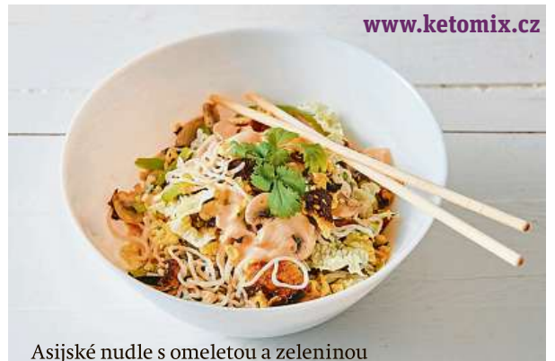
Asijské nudle s omeletou a zeleninou