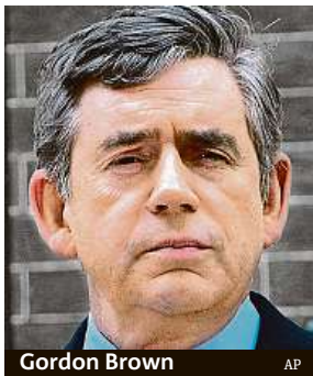
Gordon Brown

K neshodám v zemi přispívá i otázka skotského referenda o nezávislosti. Skotská národní strana (SNP) podle Browna nemá demokratický mandát k uspořádání referenda a nic na tom nezmění ani očekávané vítězství SNP v květnových volbách do skotského parlamentu. „Vědím, že teď máme na výběr mezi reformovaným státem a zhroutěným státem,“ napsal labourista Gordon Brown listu the Daily Telegraph. „Je to právě Skotsko, kde je nespokojenost tak hluboká, že ohrožuje existenci