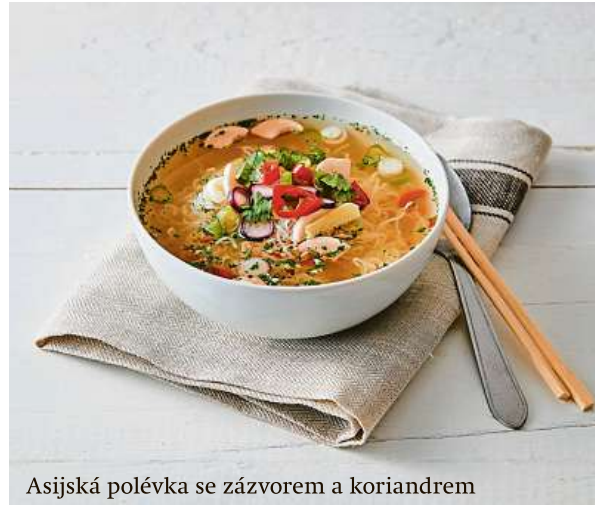
Asijská polévka se zázvorem a koriandrem

Přestanete mít přehnanou chuť k jídlu – u klasických redukčních diet lidé většinou pociťují hlad, což