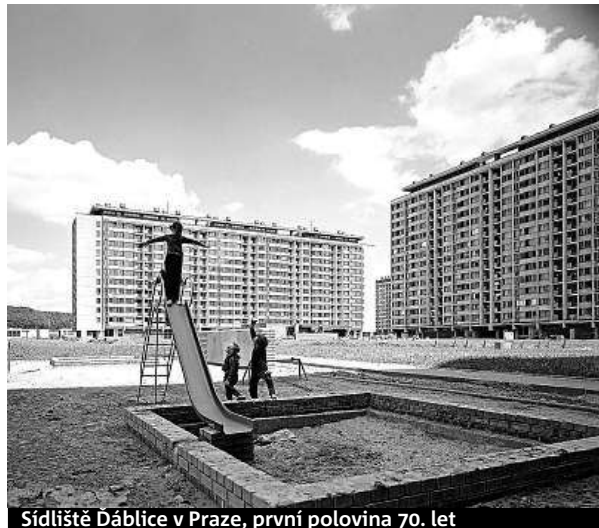
Sídliště Dáblíce v Praze, první polovina 70. let