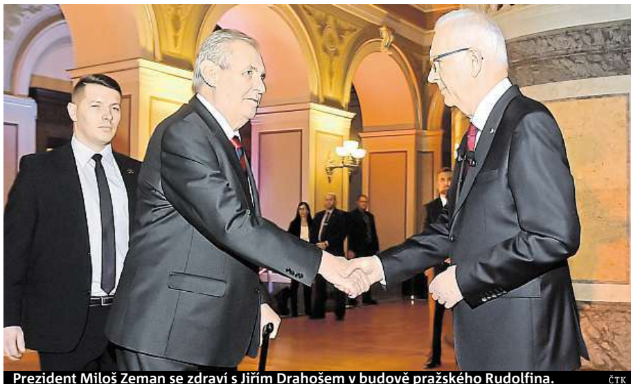
Prezident Miloš Zeman se zdraví s Jiřím Drahošem v budově pražského Rudolfinu.

Drahošovy názory se podle něj ztotožňují se zájmy českých sedláků. Zemanovi vytýkají, že podporuje velkopřemyslové zemědělství, které