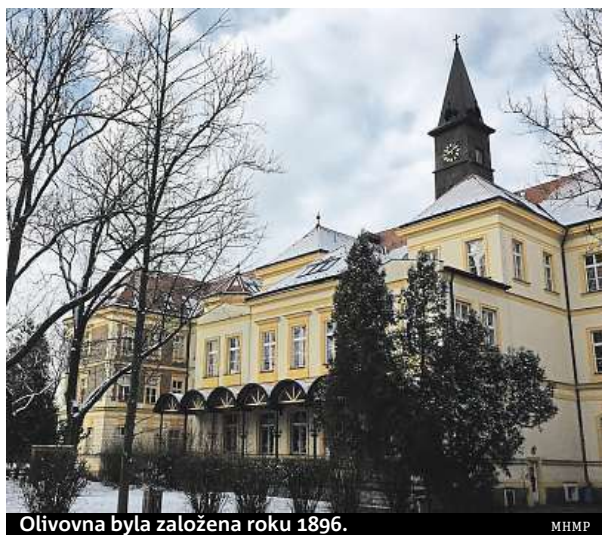
Olivovna byla založena roku 1896.