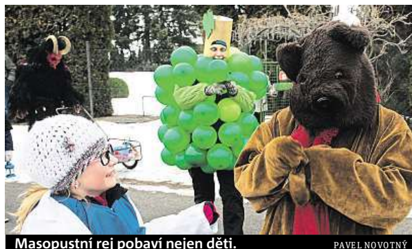
Masopustní rej pobaví nejen děti.

Třetí novinkou je dílo Jak prohrát maraton od autora oblíbeného seriálu Simpsonovi Joela Cohena, který sám trénoval na Newyorský maraton. Netradičního průvodce životem běžce načetl David Novotný. PUR