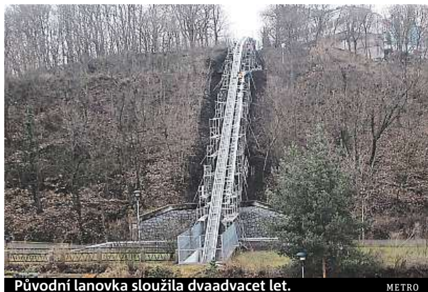
Původní lanovka sloužila dvaadvacet let.

Přestavba dráhy pro novou zdviž v parku Mrázovka zaujala deník Metro. Vydali jsme se na místo.