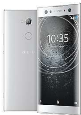
Sony Xperia XA2 MIRONET

My se dnes podíváme na největší a zároveň z uvedené trojice nejlépe vybavený model XA2 Ultra. Kromě výše zmíněného nabídne dokonce duální selfie kameru s optickou stabilizací nebo hlavní 23Mpx fotoaparát s vysokou citlivostí ISO 12800 pro kvalitnější fotografie i při špatném okolním osvětlení. Samozřejmě ani zde nechybí optická stabilizace nebo možnost natáčet superzpomalená 4K vi-