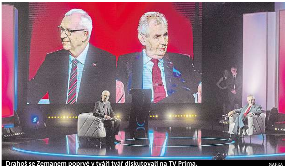
Drahoš se Zemanem poprvé v tváři tvář diskutovali na TV Prima.

Drahošovy názory se podle něj ztotožňují se zájmy českých sedláků. Zemanovi vytýkají, že podporuje velkopřemyslové zemědělství, které