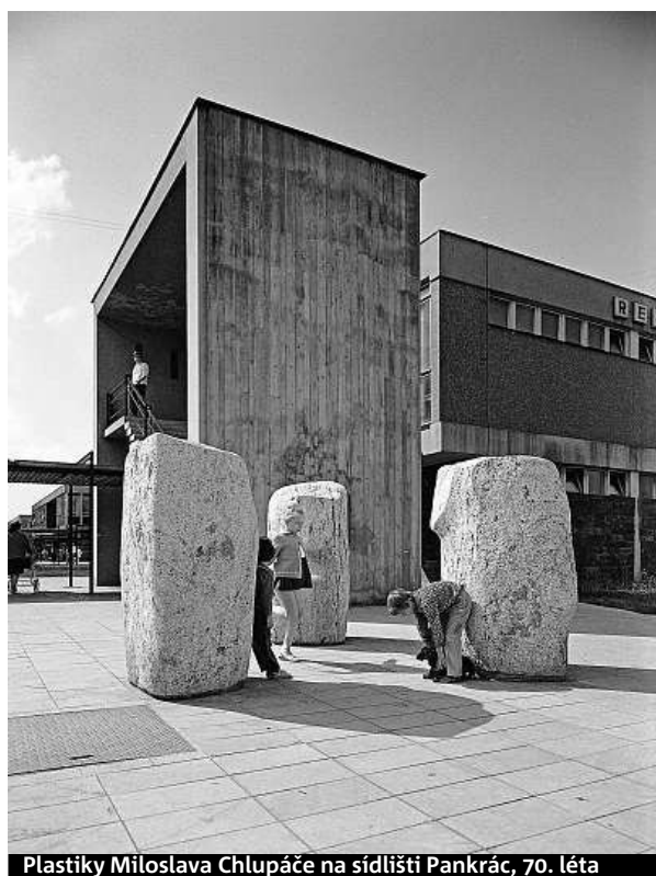
Plastiky Miloslava Chlupáče na sídlišti Pankrác, 70. léta