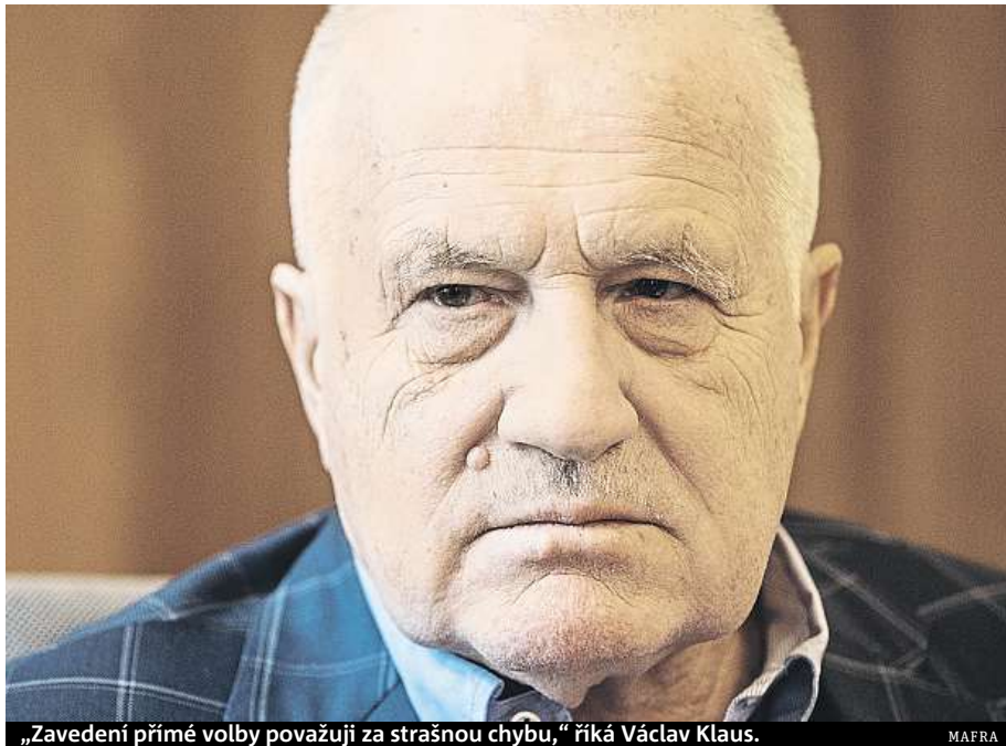
„Zavedení přímé volby považuji za strašnou chybu,“ říká Václav Klaus.