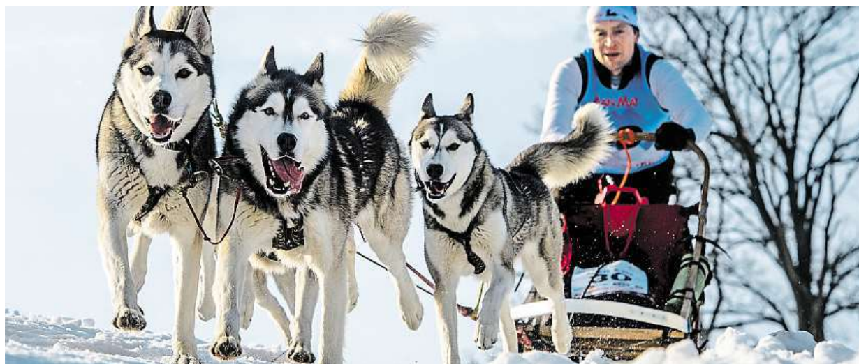
V Orlických horách až do zítřka pokračuje 22. ročník extrémního závodu psích spřežení Sediváčkův long. ČTK

Finále volby českého prezidenta. Zeman plnil funkci hlavy státu, Drahoš poskytoval rozhovory pro média. Hlasovací lístky. Tentokrát až ve volební místnosti. Sázky. Bookmakeři více věří ve vítězství Zemana STRANA 2