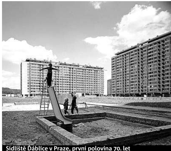
Sídliště Dáblice v Praze, první polovina 70. let