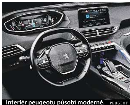
Interiér peugeotu působí moderně.