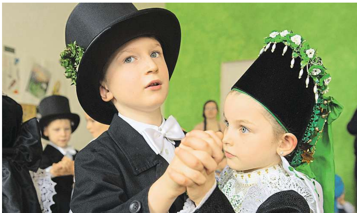
Lužičti Srbové žijící v německém Sasku včera slavili Ptačí svatbu. Svátek pochází už z pohanských dob.

Příspěvek na novorozence. Jedna ze zdravotních pojišťoven ho přidala na žádost klientů. Limity. Podle ústavů je ale rozpočet na benefity omezený. Radši vyšetření. Při výběru rozhoduje i přínos pro zdraví STRANA 4