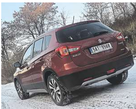
Zadní část suzuki – žádné výstřelky