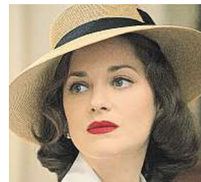
Marion Cotillardová CINE MART

Předstíraní manželské intimity přeroste v opravdovou vášeň, a proto po ukončení operace společně odjedou do Londýna, kde se vezmou. Jejich štěstí trvá do chvíle, kdy se Max dozví, že i tohle může být jen důmyslná hra, která by ve finále mohla ovlivnit výsledek druhé světové války. V tu chvíli začíná jeho zoufa-