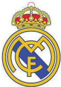
Znak bez kříže

Real už ale kříž z korunky na vrcholu loga, kterým se pyšní už od roku 1920, sundal pro zmíněný trh dřívě. V roce 2012 tak udělal kvůli plánované výstavbě umělého