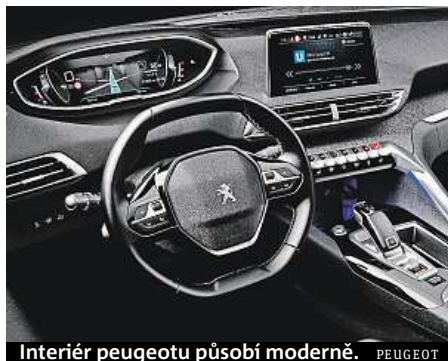
Interiér peugeotu působí moderně.