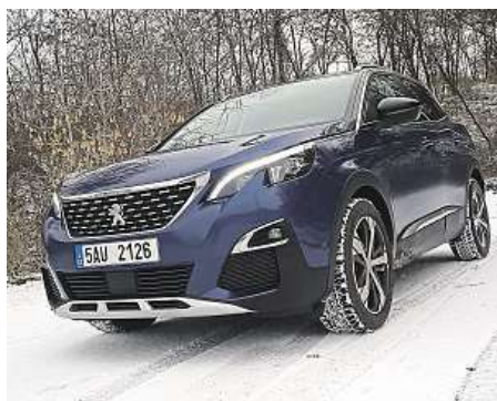
Maska nepostrádá sebevědomí.