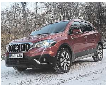
Co myslíte, prospěl redesign S-Crossu?