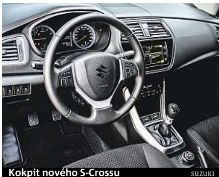
Kokpit nového S-Crossu

Co se motorů týká, nemá námi vybraná auta příliš smysl srovnávat, automobilky mají dostatek agregátů na výběr. Jen pro pořádek, ve 3008 jsme vyzkoušeli úsporný 1.6 BlueHDi o výkonu 88 kW (za 660 tisíc korun), který si dokázal poradit i s naloženým autem, příkladně přesně bylo manuální řazení a spotřeba krásná – průměrně nějakých 5,6 litru na sto kilometrů. V nabídce ale můžete sáhnout i po zážehovém tríválci 1.2 PureTech o výkonu 96 kW, na vrcholu nabídky je pak 2.0 BlueHDi se 133 kW. Podle motorů se odvíjejí ceny, které startují na 510 tisících za tríválec.