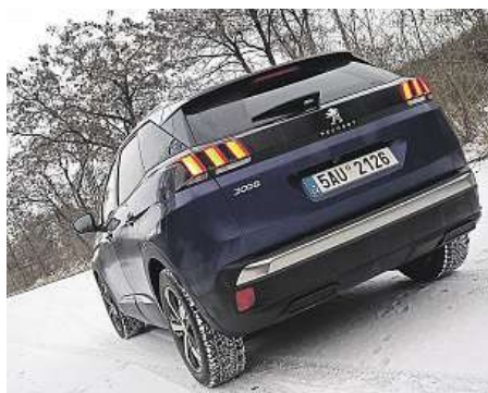
Působivé jsou zejména zadní lampy.