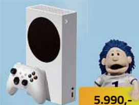
Microsoft Xbox Series S 512GB herní konzole