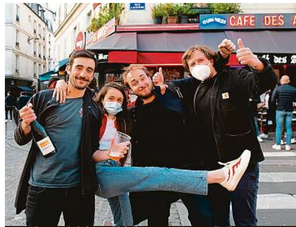
Covid a nová doba. Mládež ve Francii se změnila.