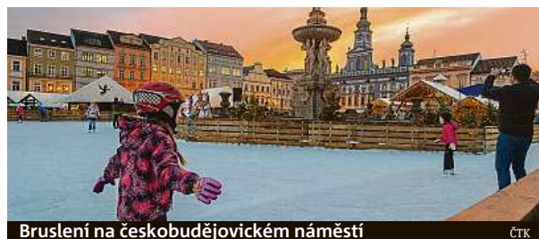
Bruslení na českobudějovickém náměstí

nad Vltavou. Na mnoha místech se konají vánočně laděné workshopy nebo koncerty. Za Mikulášem s čerty můžete vyrazit parním vlakem, na lodi či na safari (více najdete v boxu). MET