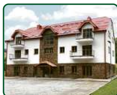
eFi ApartHotel, Horní Lipová, Lipová lázně