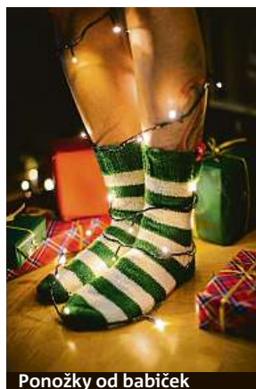
Ponožky od babiček