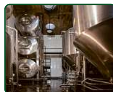
EFI Pivovar, Brno