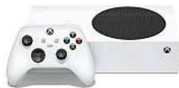
Xbox Series S 2x MIRONET

Konzole je navíc plně digitální, takže ať už se rozhodnete pro předplatnou knihovnu Xbox Game Pass, nebo si raději vytvoříte vlastní sbírku digitálních her, nebudou vám