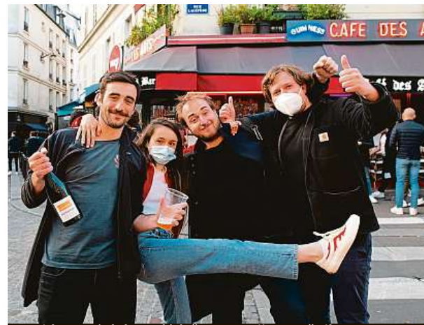
Covid a nová doba. Mládež ve Francii se změnila.