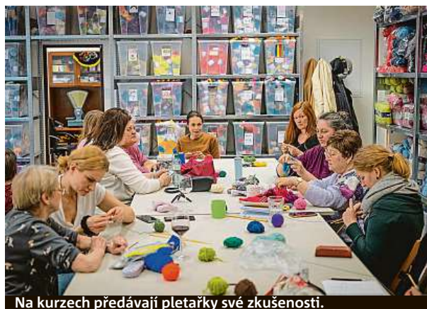
Na kurzech předávají pletářky své zkušenosti.