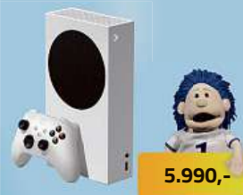
Microsoft Xbox Series S 512GB herní konzole