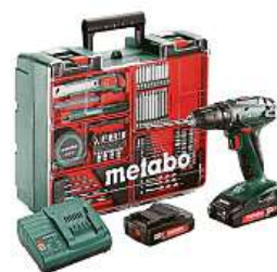
Metabo BS 18 MD Set

Sadu nářadí s vrtačím šroubovákem Metabo BS 18 MD Set koupíte snadno a rychle v internetovém obchodě Mironet.cz jen za 3560 korun.