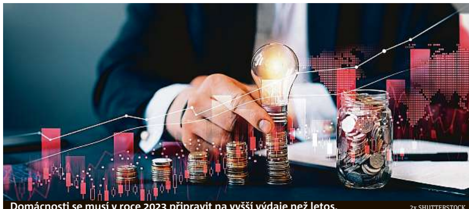
Domácnosti se musí v roce 2023 připravit na vyšší výdaje než letos.

V něm je mimo jiné konstatováno, že v domácnostech, které lze označit za nízkopří-