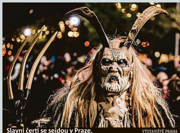
Slavní čerti se sejdou v Praze.

pekelné bytosti už zítra v Malé sportovní hale na pražském Výstavišti. Přijedou tam legendární čerti, kteří pocházejí z rakouských Alp. Odpolední program je přizpůsoben rodinám s malými dětmi. Tato část akce začne v 16 hodin. Malí čertíci, kteří odpoledne dorazí v čertovských maskách, neuniknou pozornosti místních andělů ani pekelných pomocníků. Hlavní bod večera, pekelná show, začne ve 20 hodin. Takové peklo v Praze dosud nebylo! MET