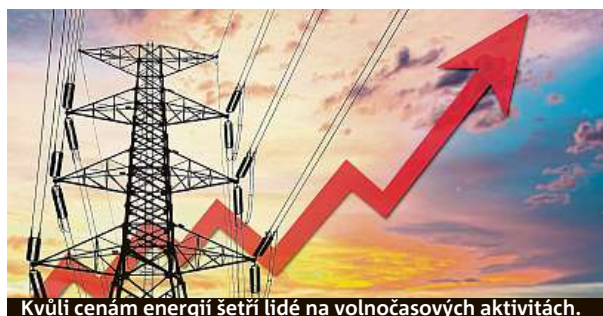
Kvůli cenám energií šetří lidé na volnočasových aktivitách.