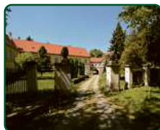
Zámek Račice, Račice-Pístovice - předzámčí