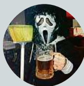
Bohumila Tušková Jak kterému. Musí také trochu vypadat.