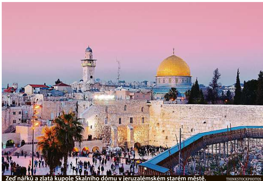
Zed' nářků a zlatá kupole Skalního domu v jeruzalémském starém městě.

K chrámu Božího hrobu poutníky zavede trasa se čtrnácti zastaveními, která připomínají Kristovo utrpení. Vždy v pátek odpoledne tudy