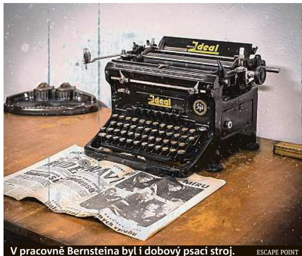
V pracovně Bernsteina byl i dobový psací stroj. ESCAPE POINT

Úkolů, rébusů, zámků či chytáček je ve hře docela dost,