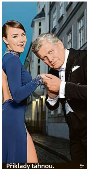
Příklady táhnou.