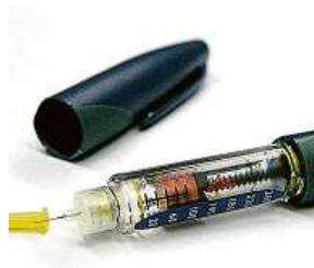
Inzulínové pero

„Nešvary moderní doby, jako je stravování ve fast foodech a nedostatečná fyzická aktivita, vedou k necitlivosti tkání v těle vůči inzulínu,“