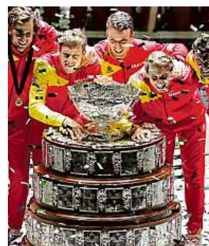
Španělé slaví.

Španělští tenisté slaví šesté daviscupový titul. V novém modelu soutěže využili v Madridu domácí prostředí a ve finále porazili Kanadu 2:0 na zápasy. Vítězný bod přidal první hráč světa Rafael Nadal výhrou nad Denisem Šapovalovem 6:3, 7:6. První bod favoritům zajistil Roberto Bautista, který tři dny po smrti svého otce porazil Felixe Augera-Aliassimea 7:6 a 6:3. Zápasem Španělů s Kanadany skončil premiérový finálový turnaj Davisova poháru v Madridu, který nahradil dosavadní tradiční model soutěže. Během týdne hrálo o trofej 18 týmů, mezi které se čeští tenisté letos nekvalifikovali. Španělsko získalo „salátovou mísu“ po osmi letech. Rekordmany soutěže jsou Spojené státy americké s 32 tituly, trofej ale tenisté USA zvedli nad hlavu naposledy v roce 2007. ČTK