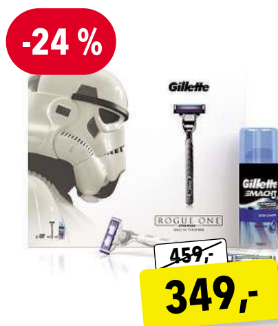
GILLETTE Mach3 - Star Wars dárková sada pro muže