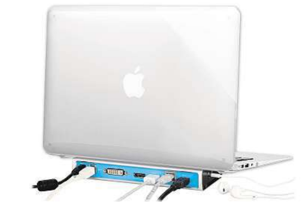
i-Tec Metal Docking Station MIRONET

Pro připojení externích monitorů, televize či projektoru lze využít DVI, HDMI a DisplayPort, přičemž použitelné jsou vždy jen dva z těchto portů. V případě současného zapojení do HDMI a DisplayPortu upřednostní grafický řadič právě DisplayPort, aby nebyl notebook, případně tablet zbytečně zatěžován.