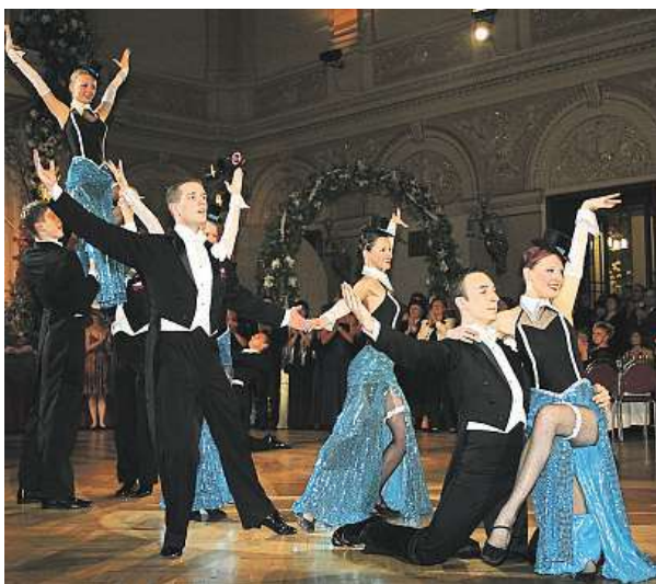
Na Žofíně se bude konat 17. rakouský ples.

Muži v obleku by měli ladit s oblečením své partnerky. Oblek, košile, kravata a motýlek by měly být jednobarevné. Ponožky by měly být jednobarevné a sladěné v tónu obleku. Pro slavnostnější ples se hodí smoking a pro dámu velká večerní toaleta. Tedy dlouhé šaty s hlubokým dekoltem a rukavičkami. Nedílnou součástí velké večerní toalety jsou lodičky na vysokém podpatku. Platí zde nepsaný zákon o délce šatů až po špičku střežičků, avšak mladé a odvážné dívky si mohou dovolit i kratší míru. Pánové by se měli vyhnout světlým oblekům určeným pro denní nošení a mokasíny. LUCIE MOTTLOVÁ