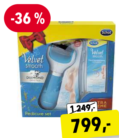
SCHOLL Velvet Smooth dárková sada pro ženy