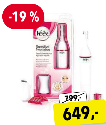
VEET Sensitive Precision dárková sada pro ženy