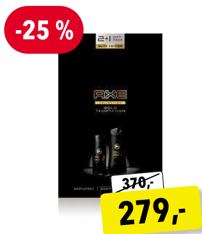
AXE Gold Temptation dárková sada pro muže