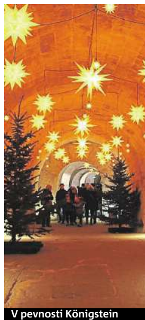
V pevnosti Königstein

Pokud jste ještě nenavštívili vánoční Vídeň, měli byste to letos napravit. Christkindlmarkt, což je největší trh na Radničním náměstí, má otevřeno již od 12. listopadu. Za návštěvu stojí i vánoční vesnička u zámku Belvedere, před jehož barokním průčelím se vyjímá majestátní vánoční strom. Vychutnat si zde můžete zpěv nejen rakouských pěveckých sborů a děti se mohou projet vánočním vláčkem. Chystáte-li se na vídeňské vánoční trhy, nezapomeňte si brusle. V okolí Radničního parku se můžete klouzat na dvou ledových plochách nebo na stezkách vedoucích přes park. Zájemci si mohou dokonce vyzkoušet curling. HOPE