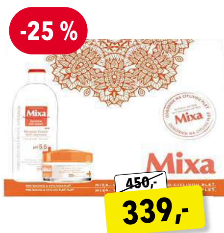
MIXA Oil Cream dárková sada pro ženy