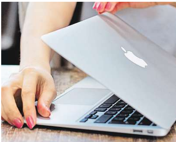
MacBook Air 13 nabízí velmi slušný výkon. MIRONET

Apple před pár týdny představil světu novou generaci MacBooků s revolučním dotykovým OLED panelem, nazývaným Touch Bar, zakomponovaným přímo do vršku klávesnice, kde nahrazuje tradiční funkční klávesy. O tom se ale rozepíšeme až někdy později, jelikož cena za nejlevnější verzi 13" MacBooku Pro, která navíc Touch Bar nedisponuje, startuje v tuto chvíli na hranici okolo