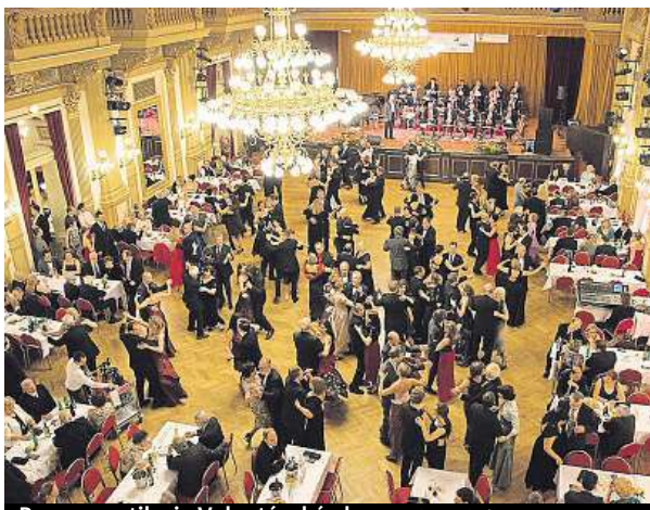
Pro romantiky je Valentýnský ples.