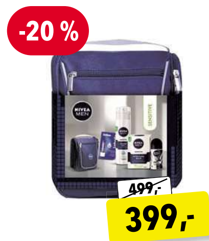
NIVEA MEN Sensitive dárková sada pro muže