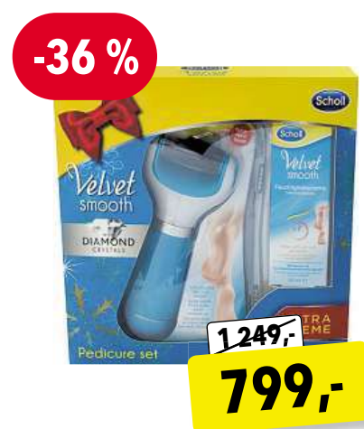
SCHOLL Velvet Smooth dárková sada pro ženy