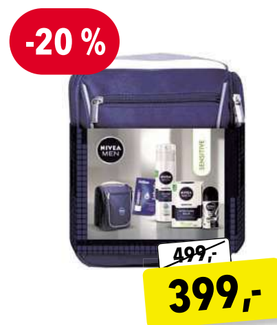
NIVEA MEN Sensitive dárková sada pro muže