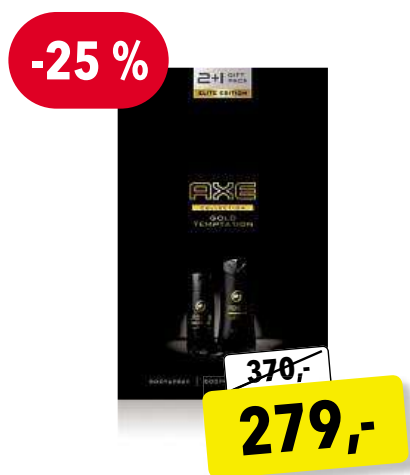
AXE Gold Temptation dárková sada pro muže