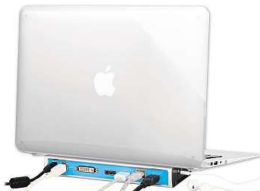
i-Tec Metal Docking Station

Pro připojení externích monitorů, televize či projektoru lze využít DVI, HDMI a DisplayPort, přičemž použitelné jsou vždy jen dva z těchto portů. V případě současného zapojení do HDMI a DisplayPortu upřednostní grafický řadič právě DisplayPort, aby nebyl notebook, případně tablet zbytečně zatěžován.