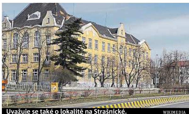
Uvažuje se také o lokalitě na Strašnické.