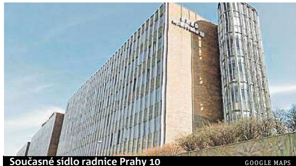
Současné sídlo radnice Prahy 10

Bližší informace o dotazníkové akci naleznete na portálu www.vpp10.cz , kde je možné zanechat i váš podnět k danému projektu. MET