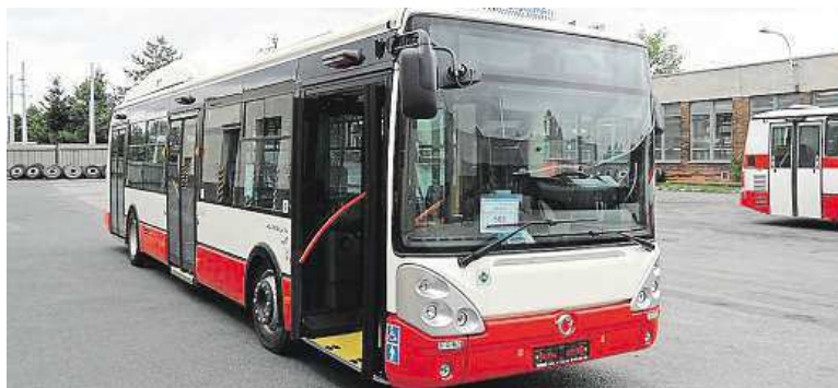
Autobusy na plyn by mohly ročně ušetřit až 30 milionů korun.