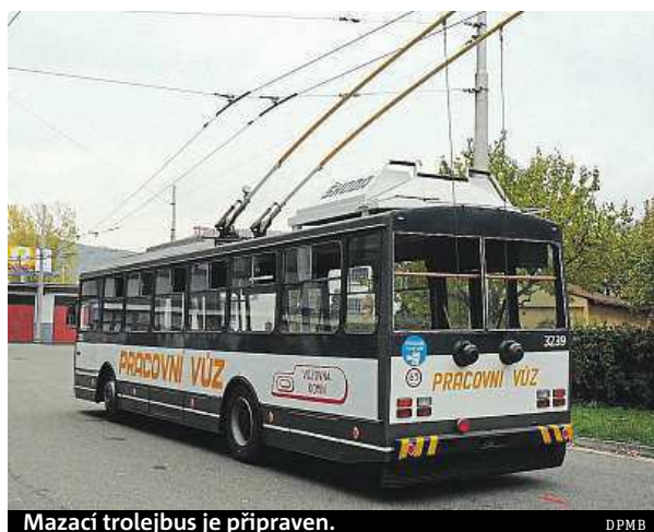
Mazací trolejbus je připraven.

Letos se dopravní podnik rozhodl jejich počet zvýšit. „Tu tramvaj jsme dosud měli jednu, nyní máme takto vybavených pět tramvajů a budou vyjíždět v noci před prvními standardními spoji,“ uvedla Hailichová. Pracovníci dopravního podniku proto musí pečlivě sledovat předpověď počasí a vyhodnocovat, jestli bude jejich speciálních vozidel v noci potřeba. Trolejbus zatím použili dvakrát. Určitě ale dojde i na jeho každodenní použití. Bude také hitem Facebooku? CAJ