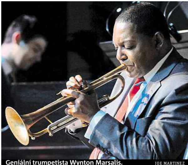
Geniální trumpetista Wynton Marsalis.

Zájem o jeho koncert je tak velký, že fanoušci jazzu a swingu vyprodali koncert během čtrnácti dní. Pořadatelům se však podařilo na stejný den domluvit ještě druhý koncert, takže se dostane i na ty, kteří s nákupem vstupenek otáleli. Rodák z New Orle-