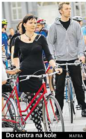
Do centra na kole MAJRA

Podle vedení města však vpuštění cyklistů nebude mít na denní situaci v centru velký vliv. Vyšší výskyt dopravních problémů nečeká ani policie. „Vzhledem k frekvenci cyklistů a roční době nečeká-