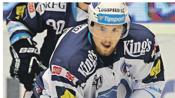
Na kluzišti za Lužánkami budou Hokejové hry.

Program na otevřeném kluzišti za Lužánkami oficiálně nazvaný Hokejové hry Brno nabídne kromě extraligových zápasů během celého týdne také další program. Ve čtvrtek 7. ledna se zde odehraje univerzitní souboj. Masarykova univerzita v něm vyzve Karlovu univerzitu. Podle klubového webu se plánují i další utkání. „Další program zatím nemůžeme specifikovat, jelikož na něm stále pracujeme. Určitě ale chceme areál využít i k dalším akcím,“ uvedl