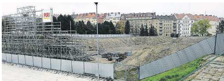
Toto místo se po úpravách stane dějištěm open air zápasů

Spotřebitelská soutěž s pivem Starobrno Drak má ještě druhou důležitou část. Nejaktivnější soutěžící se mohou těšit na deset zážitkových výher. Tři z nich si užijí jeden den s Kometou, dva výherci získávají pro sebe a svého kamaráda či partnera permanentku do VIP zóny do konce hokejové sezony (počítaje v to i zápasy play off). Další pět jednotlivců vyhraje pět permanentek na stání, a to rovněž včetně play off.