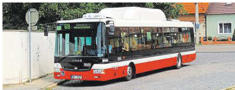
Autobusy na CNG jsou výhodné z ekonomických i ekologických důvodů.

Kromě prokazatelných ekonomických i ekologických výhod představuje nákup nových autobusů i významné zvýšení podílu nízkopodlažních vozidel. V současnosti tak máte pouze desetiprocentní šanci, že v Brně nastoupíte do autobusu, který nízkopodlažní není. BARBORA SLEZÁČKOVÁ