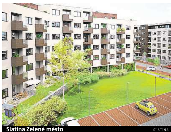
Slatina Zelené město