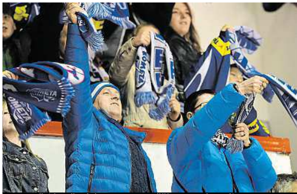
Fanošci brněnské Komety se těší na nový stadion.

Za Lužánkami už rostou tribuny pro dvacet tisíc diváků.