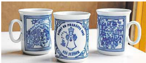
Záloha na keramické hrníčky bude 70 korun.

Konec laciných kelímků. Vánoční nápoj si nově vychutnáte z hrníčků.