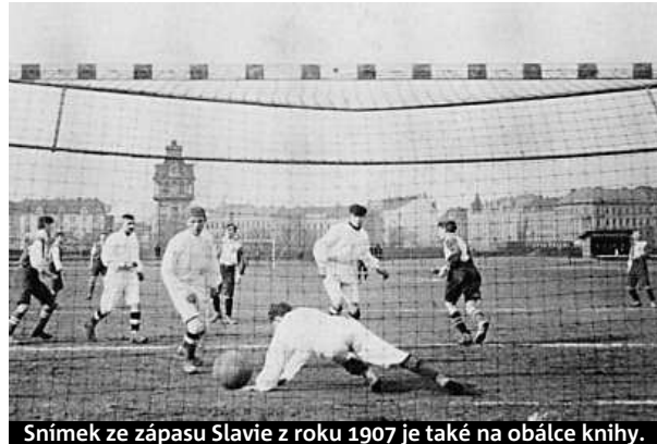
Snímek ze zápasu Slavie z roku 1907 je také na obálce knihy.

Těch by byla opět plná kronika. Připomenou třeba společnou a slavnou kariéru dvou vrstevníků i jmenovců, Karlů Koželuha a Peška řečeného Káďa. Poprvé se setkali jako kapitáni dvou klukovských part, později spolu hráli hokej za Spartu, spolu se v roce 1923 ve fotbalovém reprezentačním dresu zasloužili o vítězství nad Itálií 5:1 a za další dva roky byli i v titulu hokejových mistrů Evropy. Na Letné rovněž vyrostla a pláň proslavila řada pozdějších členů nejruznějších Siní slávy, třeba jeden z nejlepších světových brankářů František Plánička a jako střelec dodnes nepřekonaný Josef Bican.