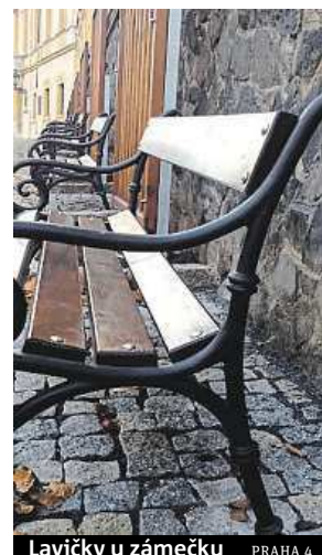
Lavičky u záměčku PRAHA 4

„Se zvelebováním městské části a opravou mobiliáře budeme pokračovat i nadále podle potřeb jednotlivých lokalit,“ dodává radní. MET