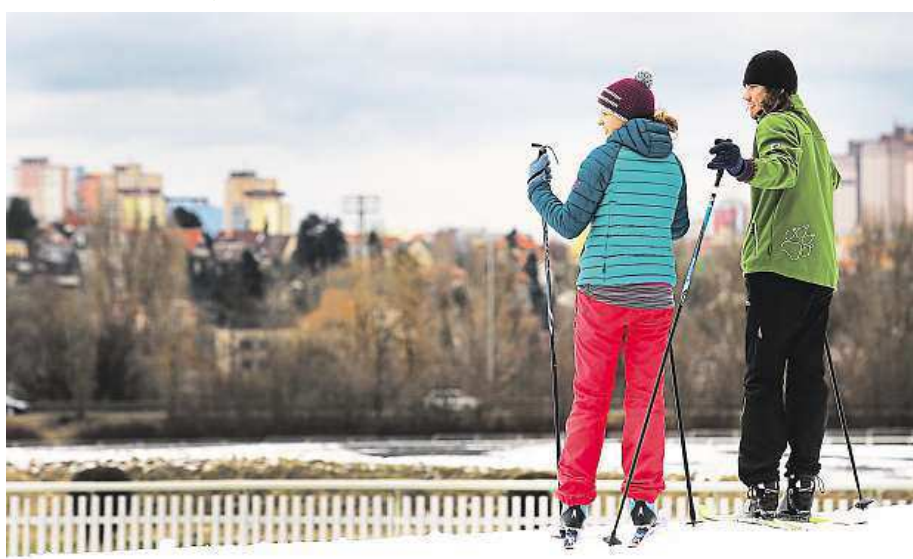
Pro milovníky běžek bude opět připraven okruh na chuchelském závodišti.

Praha 5 tradičně bruslí na smíchovské Nikolajce. Pro veřejnost se otevírá každou sobotu a neděli od 14 do 16 hodin. Vstupné platí na celé dvě hodiny – pro dospělé za 40