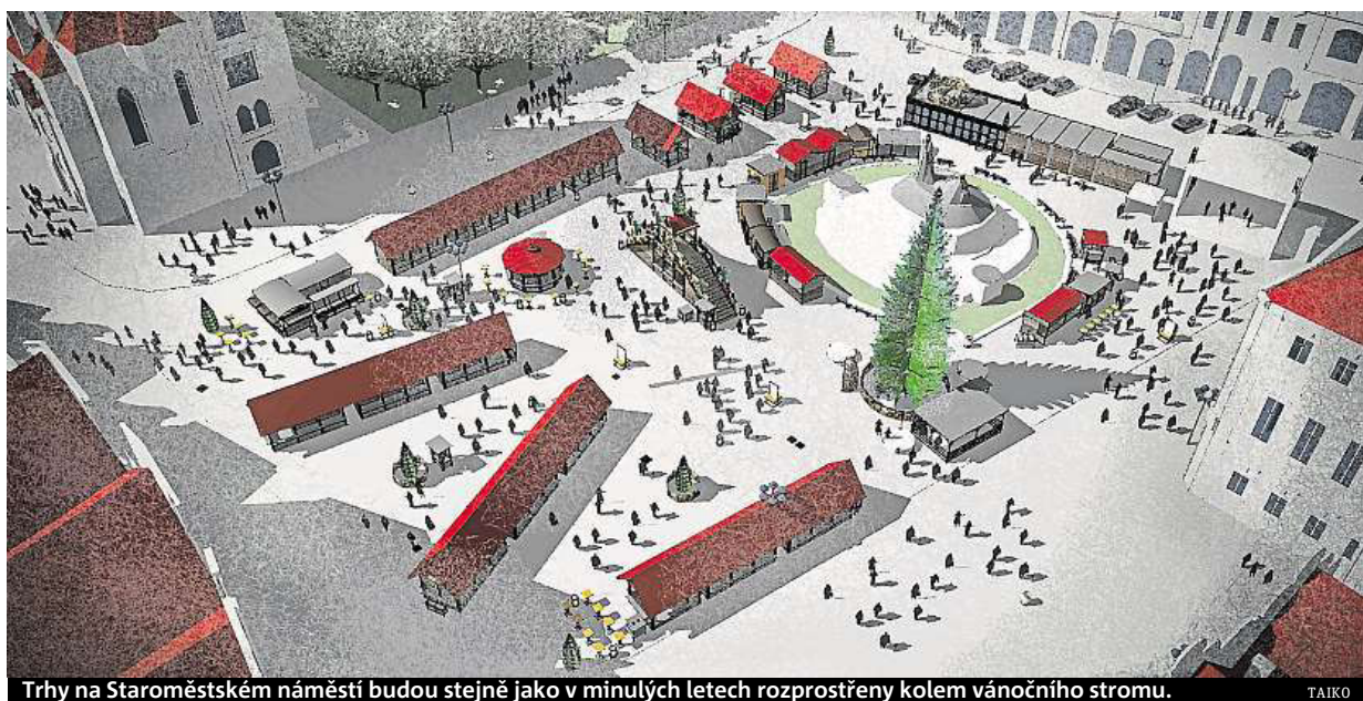
Trhy na Staroměstském náměstí budou stejně jako v minulých letech rozprostřeny kolem vánočního stromu.

Ožije také pódium. „Každý den po dobu celého adventu budou dotvářet sváteční at-