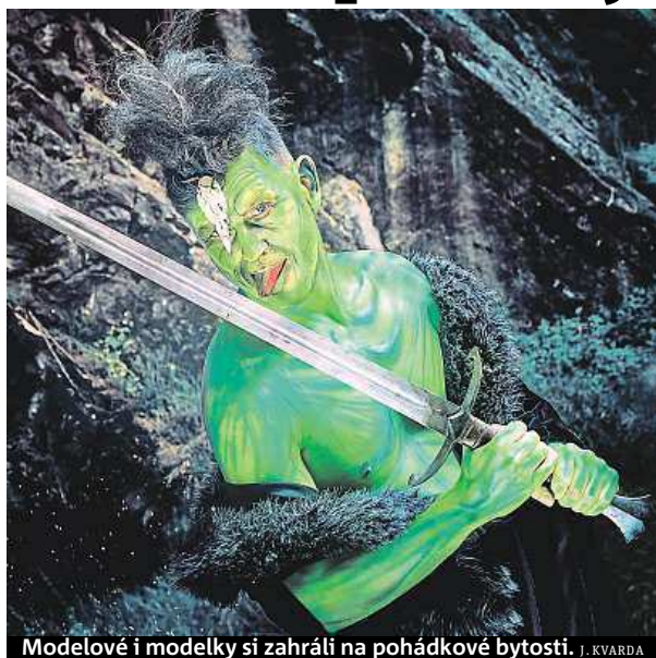
Modelové i modelky si zahráli na pohádkové bytosti.