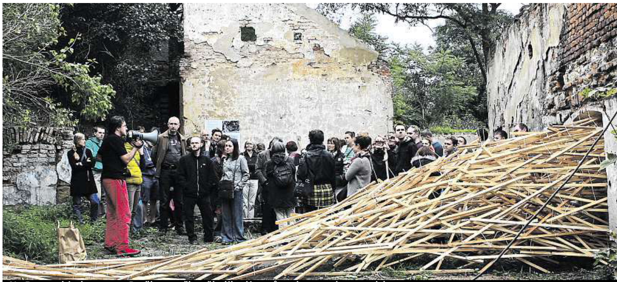
Na Den architektury se v Budánce sešlo několik zájemců o obnovu této památky.

Radnice Prahy 5 kromě prohlídky uspořádala mezi místními i průzkum o tom, co by rádi v místě vylepšili a jakou budoucnost osadě přejí. Distribuováno bylo více než 4000 tištěných dotazníků. „Během diskusí se otevřelo naléhavé téma ze strany mnoha obyvatel této lokality. Vyřešení neuspokojivé a nebezpečné situace v organizaci dopravy a křižovatek na Plzeňské ulici