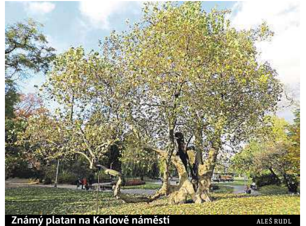
Známy platan na Karlově náměstí