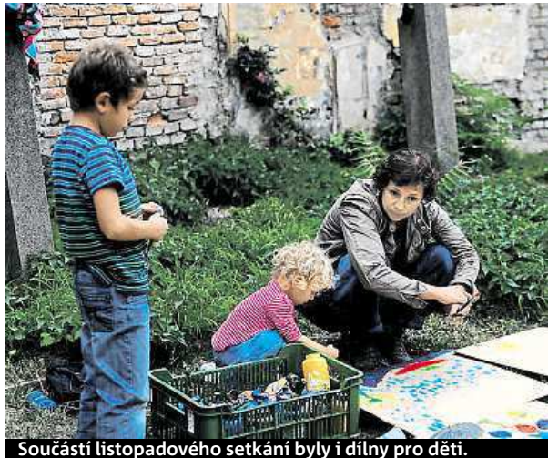
Součástí listopadového setkání byly i dílny pro děti.