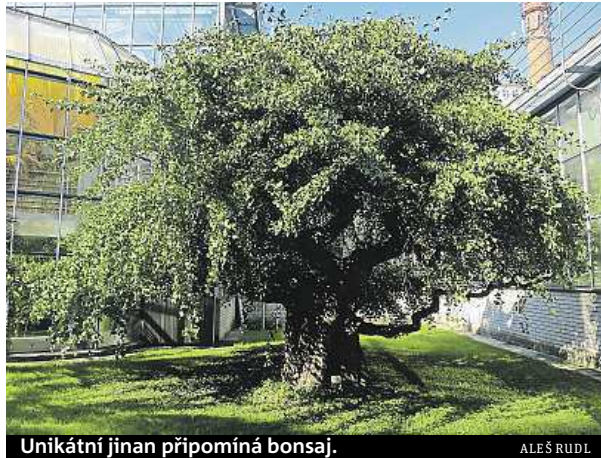
Unikátní jinan připomíná bonsaj.