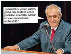
Na tento vtip reagoval. TMBK

Při odchodu ze Sněmovny Zeman doslova novinářům řekl: „Já se s vámi rozloučím tím, že mi před chvílí přinesli krásnou fotografii na internete-