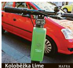
Koloběžka Lime

Francouzská ministryně dopravy v úterý parlamentu oznámila, že vláda brzy zakáže jízdu oblíbených elektrických koloběžek na chodnících. Vláda Édouarda Philippe tak reaguje na rostoucí nespokojenost zejména obyvatel velkých měst, kteří často musí před poměrně rychle jedoucími vozítky uskakovat. Elektrické koloběžky mají podle deníku Le Figaro od roku 2017 ve Francii na svědomí 286 zraněných a pět mrtvých.