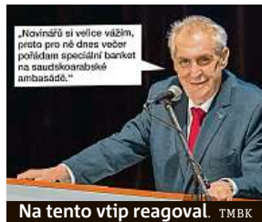
Na tento vtip reagoval. TMBK

Při odchodu ze Sněmovny Zeman doslova novinářům řekl: „Já se s vámi rozloučím tím, že mi před chvílí přinesli krásnou fotografii na internetě.“