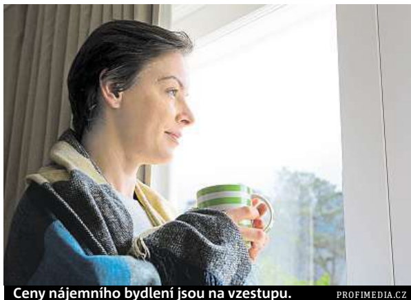
Ceny nájemního bydlení jsou na vzestupu.