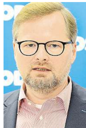
Petr Fiala z ODS