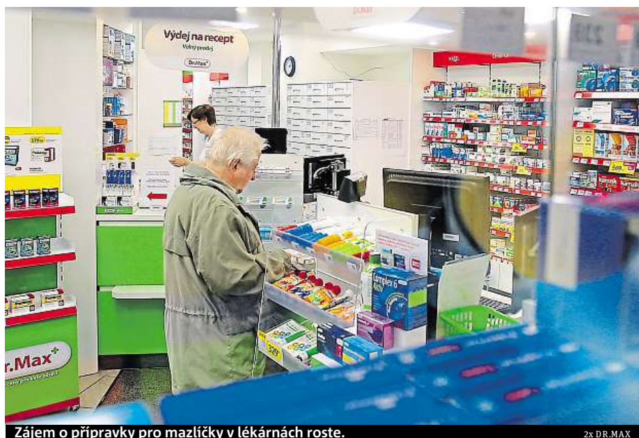
Zájem o přípravky pro mazlíčky v lékárnách roste.

To, že se do lékáren dostávají, není nic neobvyklého a Česko tím vlastně s určitým zpožděním kopíruje trendy z ciziny. Jestliže se v síti Dr.Max po-