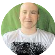
Pepa Chosee Dušičky se neslaví a Haloblabla není náš.