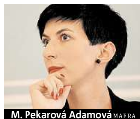
M. Pekarová Adamová

Předseda občanských demokratů Petr Fiala vyloučil jakoukoli formu spolupráce na vládě s hnutím ANO, a to i formou možné tolerance menšinové vlády. „My s hnutím ANO o vládě vyjednávat nebudeme, a když říkám, že nebudeme, tak ani o žádné podobné formě podpory,“ řekl pro iDNES.cz předseda občanských demokratů Petr Fiala. „Nejde jen o programové rozdíly a myslím, že to všichni dobře víte. ODS zveřejnila Vyšehradskou deklaraci, ve které je dvanáct bodů, které jsou nepodkročitelnou podmínkou pro vstup do vlády. Ale kromě toho jsme deklarovali naprosto jasně, s kým je pro nás z různých důvodů koalice a jednání o vládě nepřijatelné, ať už jsou to komunisté, extremisté, nebo hnutí ANO Andreje Babiše, to trvá, na to jsme dostali mandát od voličů,“ uvedl včera předseda občanských demokratů. To byla ještě před večerním vyjednáváním ANO a ODS pro Babiše špatná zpráva. Jen s ODS by Babiš měl dohromady dvoučlennou většinovou koalici. ANO má 78 poslanců, ODS 25. To by Babišovi vyhovovalo, protože chce ve vládě co nejméně stran. iDNES.cz