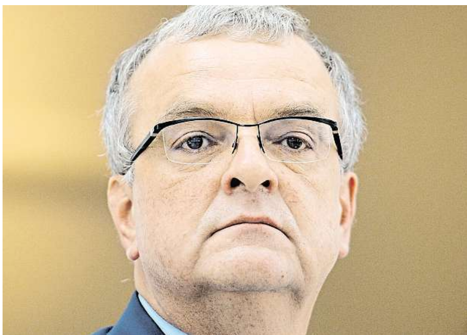
Miroslav Kalousek v listopadu skončí v čele TOP 09.