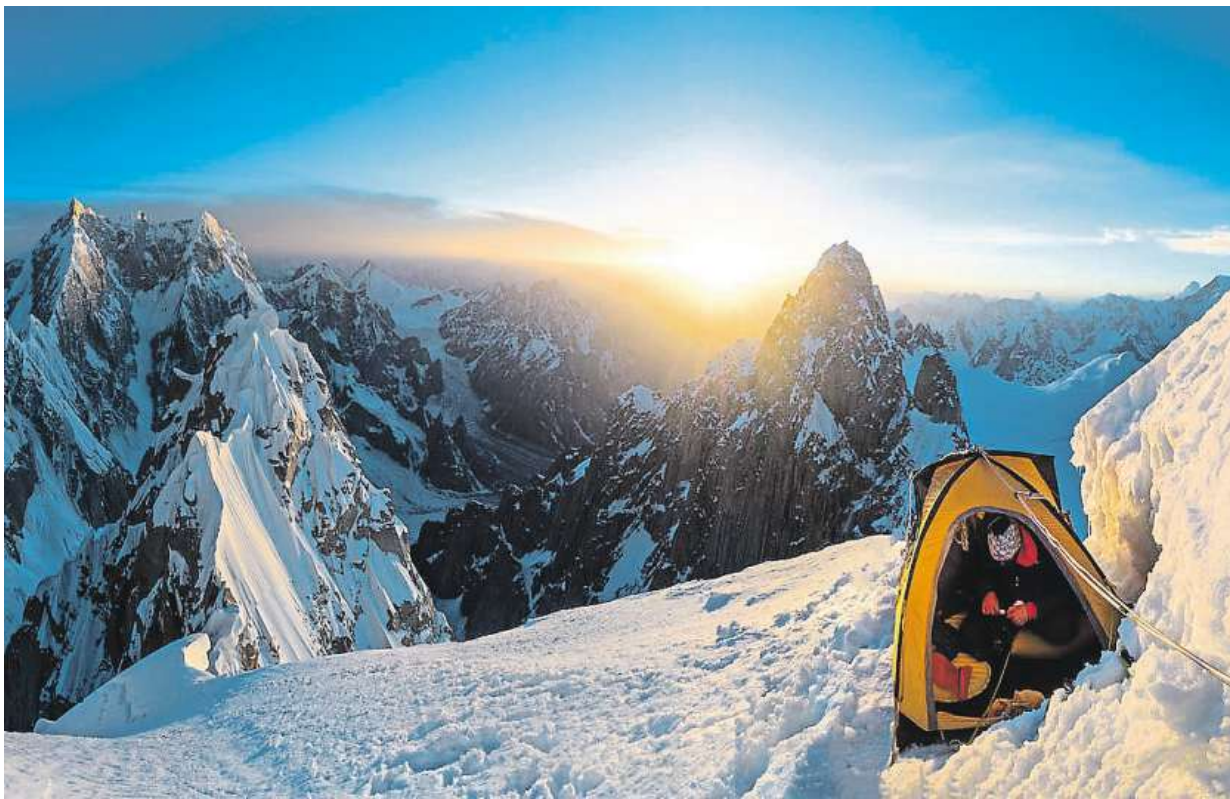
Výstup na Link Sar

„Jedná se o nonstop závod bez podpory vedoucí zimní divočinou Yukonu, kdy si kaž-