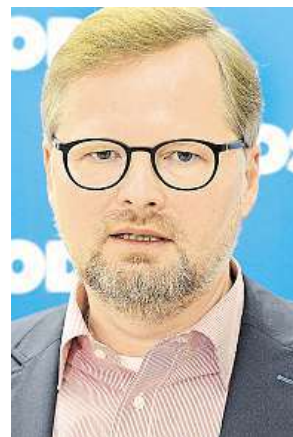
Petr Fiala z ODS

Předseda občanských demokratů Petr Fiala vyloučil jakoukoli formu spolupráce na vládě s hnutím ANO, a to i formou možné tolerance menšinové vlády. „My s hnutím ANO o vládě vyjednávat nebudeme, a když říkám, že nebudeme, tak ani o žádné podobné formě podpory,“ řekl pro iDNES.cz předseda občanských demokratů Petr Fiala. „Nejde jen o programové rozdíly a myslím, že to všichni dobře víte. ODS zveřejnila Vyšehradskou deklaraci, ve které je dvanáct bodů, které jsou nepodkročitelnou podmínkou pro vstup do vlády. Ale kromě toho jsme deklarovali naprosto jasně, s kým je pro nás z různých důvodů koalice a jednání o vládě nepřijatelné, ať už jsou to komunisté, extremisté, nebo hnutí ANO Andreje Babiše, to trvá, na to jsme dostali mandát od voličů,“ uvedl včera předseda občanských demokratů. To byla ještě před večerním vyjednáváním ANO a ODS pro Babiše špatná zpráva. Jen s ODS by Babiš měl dohromady dvoučlennou většinovou koalici. ANO má 78 poslanců, ODS 25. To by Babišovi vyhovovalo, protože chce ve vládě co nejméně stran. iDNES.cz