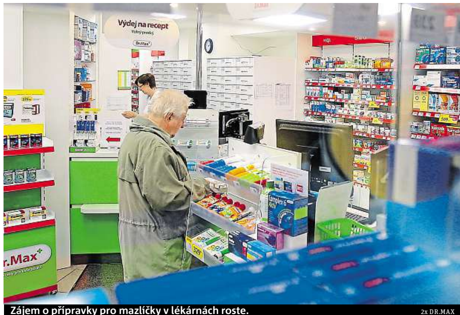
Zájem o přípravky pro mazlíčky v lékárnách roste.

To, že se do lékáren dostávají, není nic neobvyklého a Česko tím vlastně s určitým zpožděním kopíruje trendy z ciziny. Jestliže se v síti Dr.Max po-