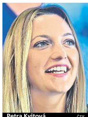
Petra Kvitová

Česká tenistka má za sebou psychicky nejnáročnější sezonu kariéry a doufá, že podobné emoce nezažije.