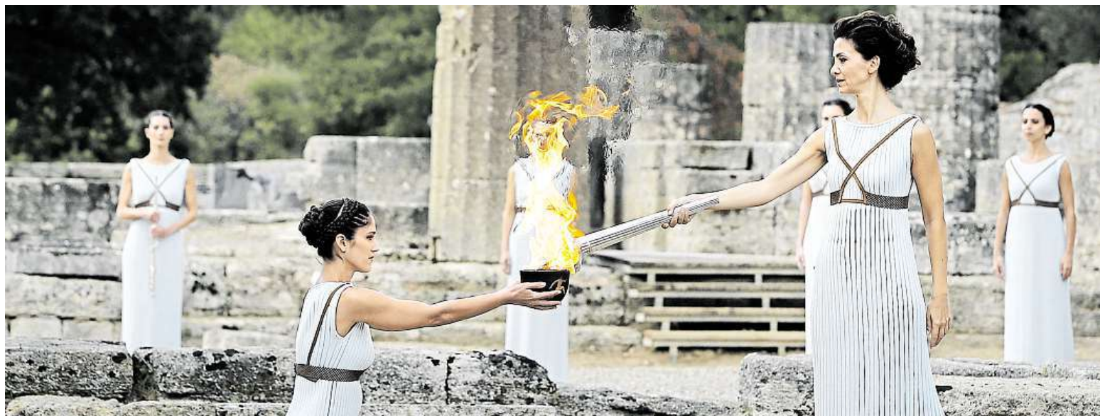
V Řecku se včera uskutečnil slavnostní ceremoniál zažehnutí olympijské pochodně. Kvůli nepřízní počasí musel být použit oheň z pondělní generálky. AP

Ani menšinovou vládu. Předseda ODS Petr Fiala vyloučil jakoukoli formu podpory vítězného hnutí ANO. TOP 09. Miroslav Kalousek nebude v listopadu na sněmu kandidovat na post předsedy strany STRANY 2-4