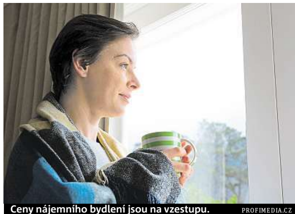
Ceny nájemního bydlení jsou na vzestupu.