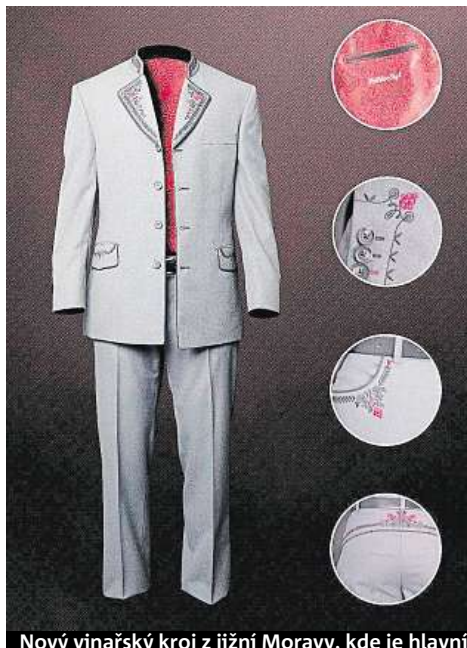
Nový vinařský kroj z jižní Moravy, kde je hlavním symbolem vinná réva.

Střih je jednoduchý, se stojáčkem, v pánské i dámské verzi. Dominantní jsou na něm výšivky v barvách černé a vínové, které vycházejí z moravského folkloru a lidových tradic, odkazují na vi-