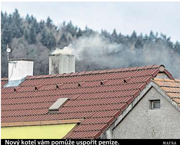
Nový kotel vám pomůže uspořit peníze.

Kraj přijímá žádosti elektronicky a poté do pěti dnů v papírové formě. Chce tím zamezit frontám. Lidem, kteří nemají počítač nebo internet, pomohou s vyplněním žádosti pracovníci kraje.