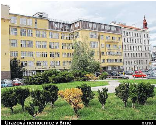
Úrazová nemocnice v Brně

Endoskopie je vyšetřovací metoda tělních dutin a dutých orgánů za pomoci přístroje nazvaného endoskop.