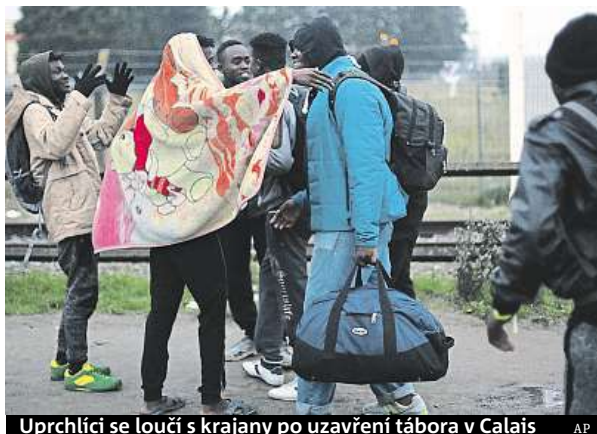
Uprchlíci se loučí s krajany po uzavření tábora v Calais

Džungle, tak nazývají uprchlický tábor v přístavním městě Calais, v němž přebývalo v hrozivých podmínkách až osm tisíc lidí. Teď ho začínají úřady vyklízet. Evakuace, kterou francouzská vláda označuje za humanitární, začala oficiálně v 8 hodin ráno. Ale již od šesté hodiny přicházely desítky žen a mužů se zavazadly k hangáru, který slouží jako hlavní štáb této operace. Ředitel úřadu pro imigraci a integraci Didier Leschi uvedl, že za první den by se mělo podařit rozvézt do různých francouzských středisek více než dva tisíce lidí. Na klidný