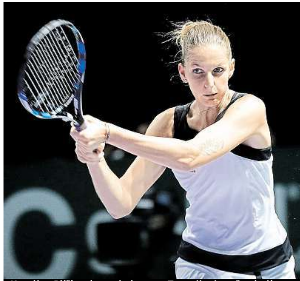
Karolína Plíšková první zápas na Turnaji mistryň vyhrála.

Rozhodovalo se tedy až ve třetí sadě. Psychická výhoda byla na straně Muguruzaové, což hned potvrdila dalším brejkiem. Španělka utekla až do vedení 4:1. Šestý gem se