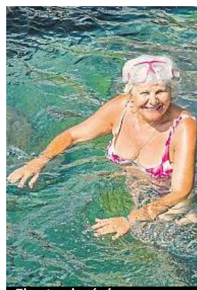
Zkuste plavání.

Pohyb je pro seniorský věk nenahraditelný. Cvičení sice neumožní zcela odstranit zdravotní potíže, ale může podstatně snížit jejich další rozvoj. „Tělesná aktivita ve vysokém věku navíc kromě tělesné schránky udržuje v dobré kondici i mozek,“ říká neuroložka Jana Filipová a pokračuje: „Podle posledních výzkumů pohyb zlepšuje přítok krve do mozku a tím snižuje nebezpečí demence a mrtvice. Kromě toho tělesná aktivita stimuluje růst nervů v oblasti mozku, která podstatně ovlivňuje pa-