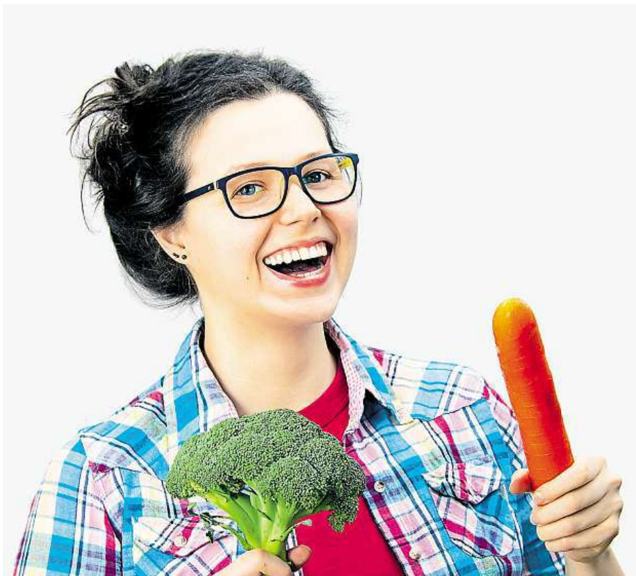
Mrkev i brokolice patří mezi potraviny, které vašim očím prospívají.

Obecně se doporučuje pracoviště, které dělá velké počty zákroků, nabízí široké spektrum různých metod, má ve svém týmu řadu odborníků, a to také v různých oblastech refrakční chirurgie (laserové i nitrooční). Zvolená klinika by měla mít zajištěnou pohotovost o víkendech. ANNA BERKOVÁ