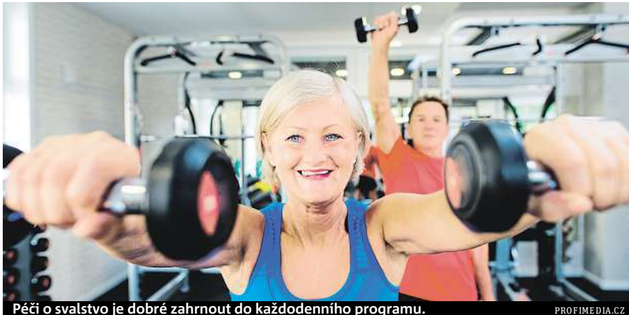
Péči o svalstvo je dobré zahrnout do každodenního programu.

Kromě zdravé výživy zahrňte do svého každodenního programu i péči o svalstvo. Na něm totiž závisí i tak obyčejné věci jako vstát z postele. Ukazuje se, že svaly, či spíše jejich hmota a síla, budou u většiny z nás rozhodovat o tom, zda tady vůbec budeme. Svalová hmota je totiž jedním z hlavních faktorů schopných předpovědět riziko nemocnosti. V posledních letech se kromě svalové hmoty objevila i řada důkazů o tom, že možná ještě důležitější než svalový objem je svalová funkce. Mechanismy, které vedou ke ztrátě svalové