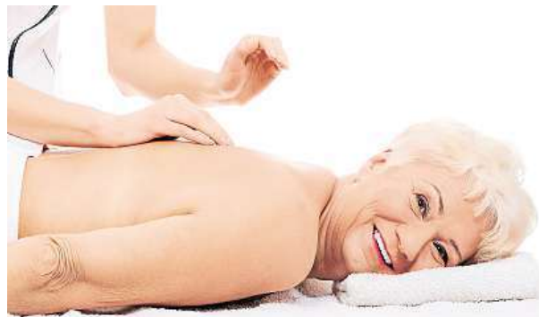
Podzim v lázních pomůže odreagovat se.

Podzim je k návštěvě lázní ideální. Jsou méně plné a také levnější než v plné sezoně.