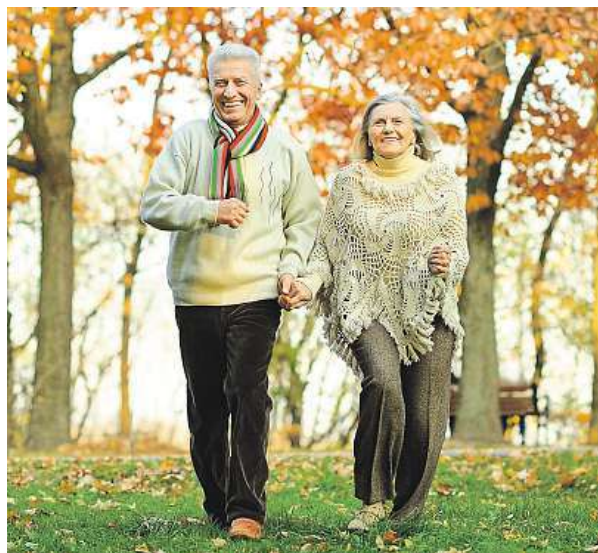
Pohybovou aktivitu provozujte pravidelně.

Samotní vědci byli natolik pozitivními výsledky svého výzkumu zaskočení. Pravidelné cvičení nejenže vedlo ke zlepšení fyzické kondice seniorů, ale přímo působilo jako lék proti stárnutí, což bylo vidět na zvýšení počtu aktivních genů. Rovněž se „probudily“ geny, které mají významný účinek proti vzniku cukrovky či kardiovaskulárních chorob. Tento průzkum je jasným důkazem, že na cvičení není nikdy pozdě.