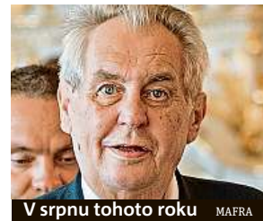
V srpnu tohoto roku MAFRA

úplně poctivý v rehabilitacích. „Nejenom že se mi nelepší nohy, ale ještě špatně slyším a mám poměrně nízký tlak, což jsem dříve neměl,“ řekl. Také prozradil, že omezil kouření. „Zatím jsem zredukoval spotřebu cigaret ze 60 na 40 a pokládám to za velký úspěch,“ uvedl. IDNES.cz