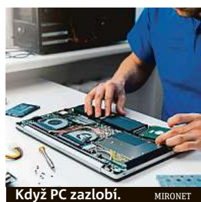
Když PC zazlobí. MIRONET

Něco nepracuje, jak má? Nefunguje vám počítač či telefon? Toužíte po upgradu?