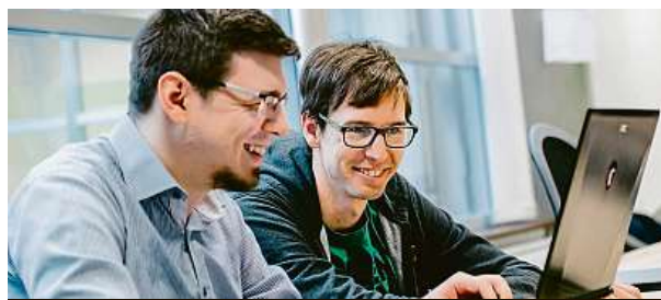
Budoucnost patří ajťákům.

Celková čísla jsou ovšem neúprosná. Mužů pracujících v IT je 91 procent. Žena je mezi IT odborníky jen každá desátá. MET