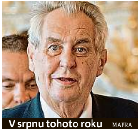
V srpnu tohoto roku