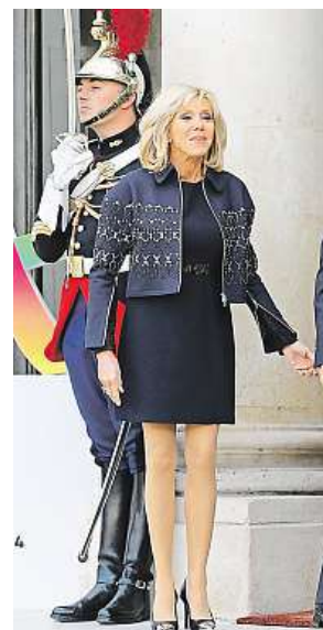
Brigitte Macronová

Macronová si pro tuto příležitost oblékla černé šaty od