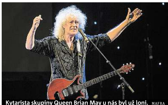
Kytarista skupiny Queen Brian May u nás byl už loni.

Zahrančních hvězd dorazí do České republiky opravdu velké množství