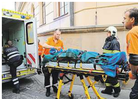
2x HASIČI PRAHA, ČTK