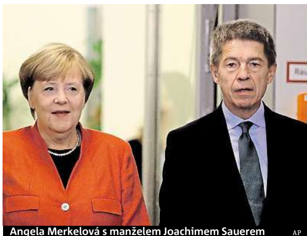
Angela Merkelová s manželem Joachimem Sauerem

Nejsilnější CDU/CSU měla v průzkumech podporu kolem 36 procent voličů. Druhé místo by podle předpokladů měli obsadit sociální demokraté (SPD). U nich se předpo-