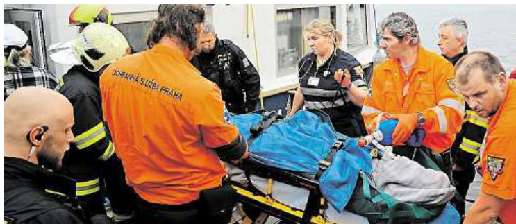
Záchranáři pomáhají po vytažení z Vltavy.