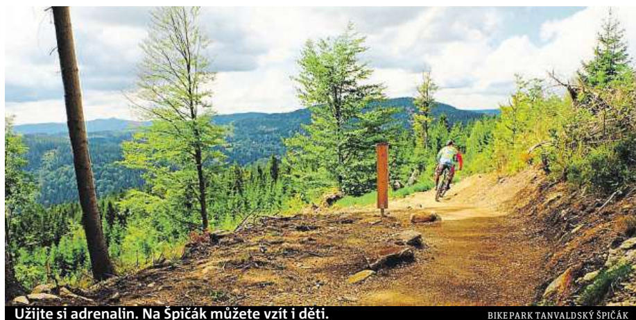
Užijte si adrenalin. Na Špičák můžete vzít i děti.