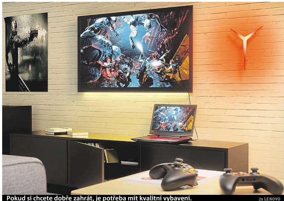
Pokud si chcete dobře zahrát, je potřeba mít kvalitní vybavení.