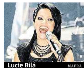
Lucie Bílá MAFRA