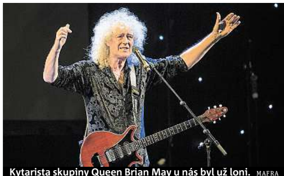
Kytarista skupiny Queen Brian May u nás byl už loni.

Zahrančních hvězd dorazí do České republiky opravdu velké množství