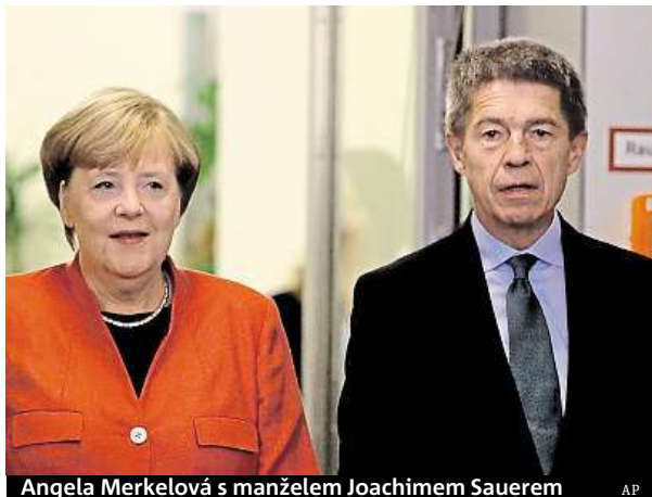
Angela Merkelová s manželem Joachimem Sauerem

Nejsilnější CDU/CSU měla v průzkumech podporu kolem 36 procent voličů. Druhé místo by podle předpokladů měli obsadit sociální demokraté (SPD). U nich se předpo-