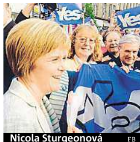
Nicola Sturgeonová

nii. Podle komentářů se uchopení moci této zkušene a vlivné političce asi povede. Dosaďadní předseda SNP a šéf skotské vlády Alex Salmond se po hlasování rozhodl obě funkce opustit.