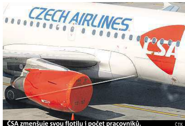
ČSA zmenšuje svou flotilu i počet pracovníků.