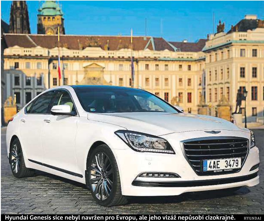
Hyundai Genesis sice nebyl navržen pro Evropu, ale jeho vizáž nepůsobí cizokrajně. HYUNDAI

Hyundai začal v Česku prodávat reprezentativní sedan Genesis za více než 1,6 milionu korun. Svezli jsme se s ním.