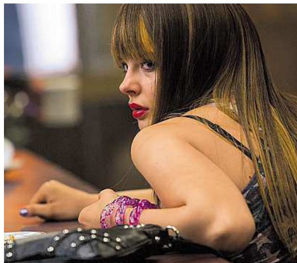
McCall (Denzel Washington na fotce vlevo s nožem) se kvůli dívce Teri (Chloe Grace Moretz) utká s ruskými gangstery.