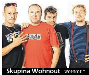
Skupina Wohnout WOHNOUT