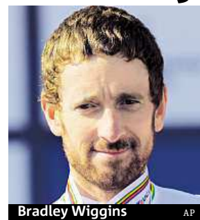
Bradley Wiggins

Český cyklista Jan Bárta skončil v časovce na MS ve španělské Ponferradě na 9. místě. Své první zlato získal Brit Bradley Wiggins, vítěz této disciplíny na olympiádě v Londýně 2012, jenž tak překazil útok na rekordní čtvrtý triumf za sebou Tonymu Martinovi z Německa. Ten dojel druhý, třetí byl Nizozemec Tom Dumoulin. Další Čech Petr Vakoč obsadil 29. místo.