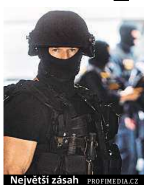
Největší zásah

Devítidenní akce, přes tisíce zadržovaných. Europol zasahoval ve 34 zemích včetně Česka.