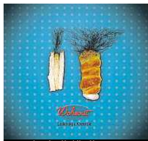
Nové „sladké“ album