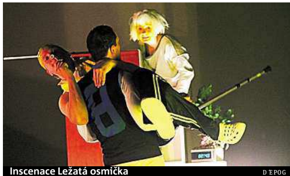
Inscenace Ležatá osmička

Letošní ročník nabídne i několik novinek a premiér: „Poprvé v Praze uvedeme Ležatou osmičku – inscenaci brněnské progresivní skupiny D'Epog, která se bude odehrávat v Malé dvoraně ve Veletřním paláci. A protože je to projekt mimořádný, vstupné bude zdarma. Premiérově uvedeme také dvě bytová divadla, jež se vyznačují intimi-