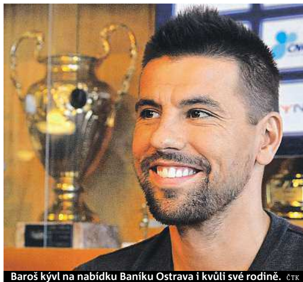
Baroš kývl na nabídku Baníku Ostrava i kvůli své rodině. ČTK

Navzdory těžkému zranění a dlouhé rekonvalescenci neměl nouzi o nabídky. Odmítl bohaté zájemce z Perského zálivu, jižní Evropy či nové vznikající profesionální ligy v Indii i domácí kluby, a to včetně Sparty i Slavie. ČTK