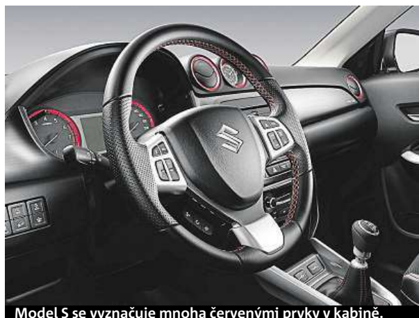
Model S se vyznačuje mnoha červenými prvky v kabině.