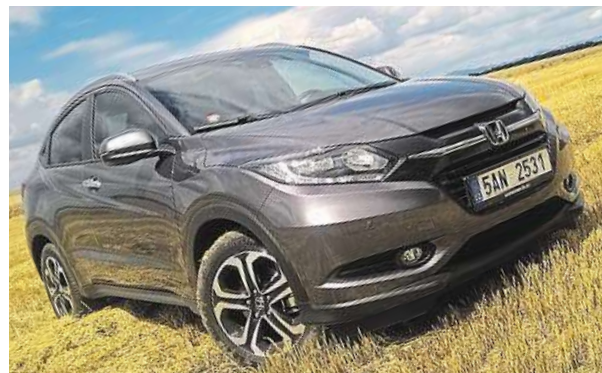
Honda HR-V šla spíše cestou zaoblených tvarů.