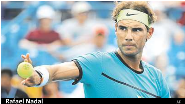
Rafael Nadal

Velkých tenisových zápasů už zažila pražská O2 arena celou řadu. Vždyť se tu odehrály finálové bitvy českých tenistů i tenistek. Za rok se ale do Česka (22. až 24. září) sjedou velké tenisové osobnosti z celého světa. Chybět by neměli Švýcar Roger Federer či Španěl Rafael Nadal.