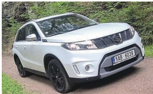
Díky přední masce působí Vitara S sebevědomě.