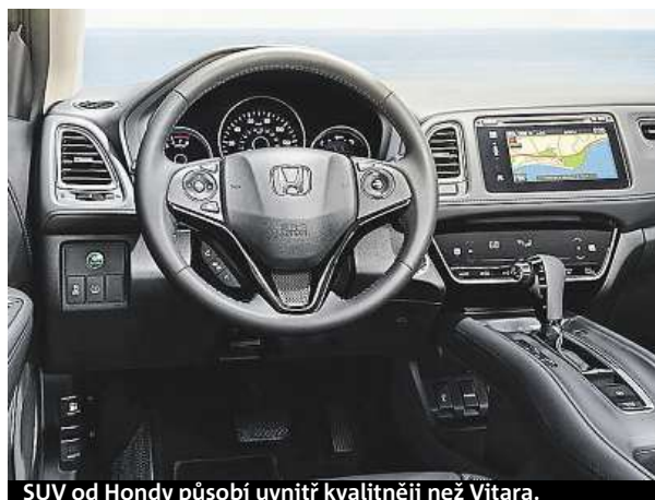
SUV od Hondy působí uvnitř kvalitněji než Vitara.