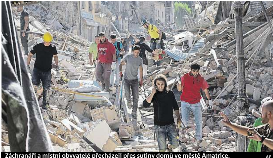
Záchranáři a místní obyvatelé přecházejí přes sutiny domů ve městě Amatrice.

Nejtragičtější bilanci hlásí Amatrice, které udává 35 mrtvých. Nedaleké Accumoli oznámilo 11 obětí. Dalších 17 mrtvých eviduje město Ascoli Piceno, tento údaj za-