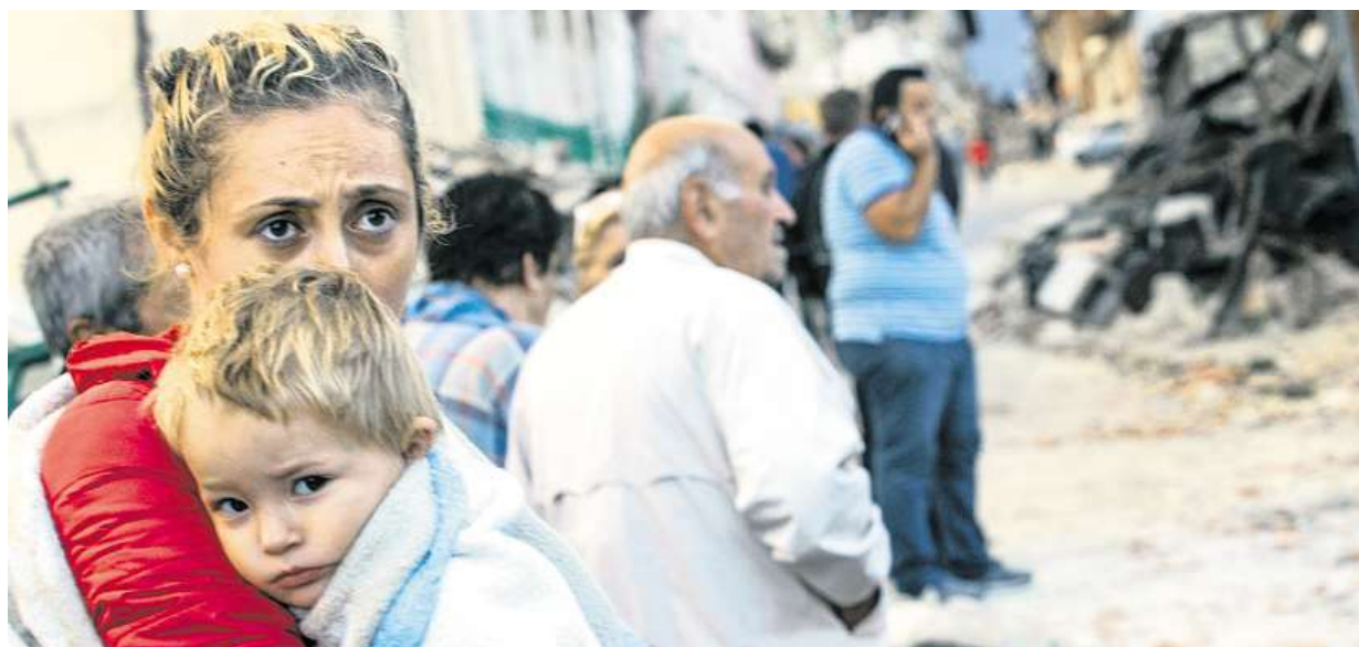
Včerejší silné zemětřesení ve střední Itálii připravilo o střechu nad hlavou tisíce lidí. Více na straně 4.

Přes internet. Kartička s čipem se začne vydávat od roku 2017 a umožní pořídit výpis z katastru či podat daňové přiznání z pohodlí domova. Má to být snadné. Postačí si jen pořídit čtečku k počítači STRANA 3