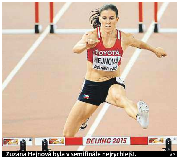
Zuzana Hejnová byla v semifinále nejrychlejší.

Ženskou stovku vyhrála Jamajčanka Shelly-Ann Fraserová-Pryceová v čase 10,76. Francouzský tyčkař Renaud Lavillenie bral jen bronz. Překvapivě vyhrál Kanadán Shawn Barber s výkonem 590 centimetrů.