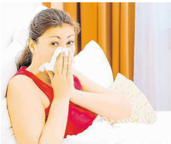
Horečkou tělo ničí nepřátelské organismy.

Kdo se snaží horečku snížit už v jejím zárodku, dělá tak vlastně chybu. Zabraňuje